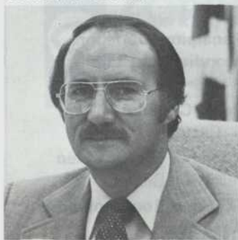
L'Honorable Guy Tardif Ministre de l'Habitation et de la Protection du Consommateur

Au moment d'aller sous presse, le ministre de l'Habitation et de la Protection du consommateur, l'Honorable Guy Tardif, nous a confirmé sa présence à la tribune des déjeuners-causeries de la Chambre. Il nous entretiendra, à cette occasion, de l'importance de l'industrie de l'habitation pour Montréal.