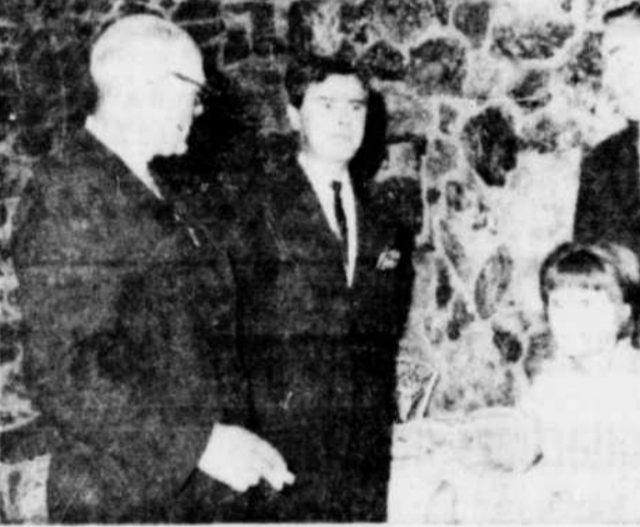
LE THEATRE POPULAIRE MOLSON présentera à Victoriaville, le 17 septembre, la fameuse comédie "13 à table". Les recettes de cette représentation seront divisées entre la Société St-Vincent-de-Paul de Victoriaville, et la Corporation des Gouverneurs scouts. Sur la photo, prise lors d'une conférence de presse

Je crois donc que pour décongestionner la circulation du centre des affaires, la ville devrait bâtir d'autres terrains de stationnement dans certaines rues fort étroites."