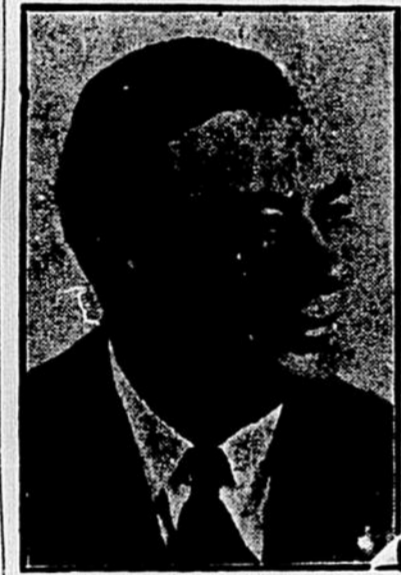
L'hon. Irenée Vautrin, ministre de la Colonisation.

Ouvrir une rue de cent pieds, pour continuer la rue Berri actuelle, d'une trentaine de pieds, au sud de la rue Ste-