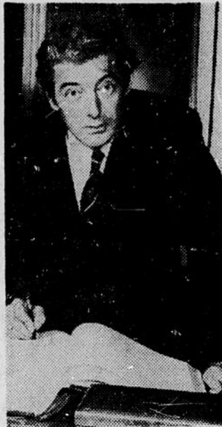
FELIX LECLERC INVITE A MUSIC-HALL