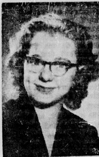
JOSEPHITE DUFRESNE , brillante pianiste canadienne, sera l'artiste invitée à CONCERT , le dimanche 16 avril à 3 heures, au réseau français de télévision de Radio-Canada.