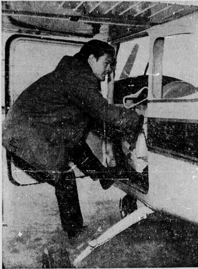
En "pente douce" dans les airs