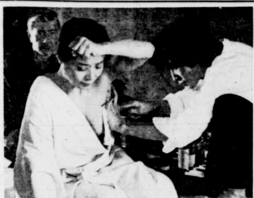
Une scène du film pendant une session de tatouage.