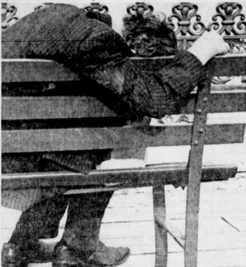
Il y aurait une personne alcoolique par 20 buveurs ou buveuses.

xicomanie, en faisant le lien avec les mauvaises conditions de travail, l'identification des conditions de travail qui favorisent le développement de l'alcoolisme, des programmes syndicaux d'aide à la toxicomanie, un texte interdisant le congédiement pour toute maladie que ce soit par mesures administratives ou disciplinaires et dans les plans d'assurance, le paiement de la totalité des coûts de traitement pour toxicomanie.