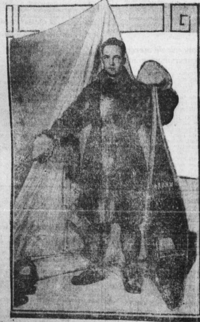
On voit ici Byrd, le commandant de l'expédition américaine dans l'Antarctique dans son accoutrement d'explorateur. On apprend que lui et ses compagnons sont à la veille de manquer de provisions.