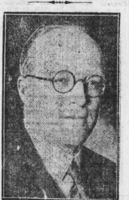
Le nouvelliste anglais HUGH WALPOLE.

Au 18 janvier 1930, la ville et la compagnie des Tramways avaient dépensé pour l'enlèvement de la neige dans les rues et sur les trottoirs, $940,555.00. L'année dernière, à la même date, la dépense n'avait été que de $431,331.