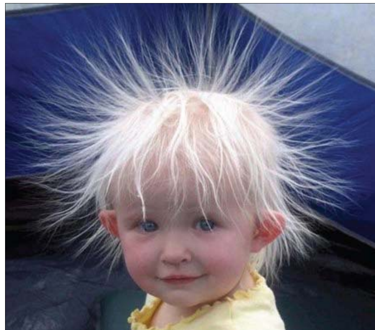
Les effets du shampooing avec caféine.

Un paysage qui vaut le road trip en Gaspésie. Bref, la fille dit : « on ne se tanne jamais de ça hein ? ». Sans réponse et zoom out où on aperçoit un gars en train de pitonner sur son téléphone, manquant le spectacle. Le narrateur : « Il y a des amis plus fidèles que d'autres... » Voilà une bonne raison pour les femmes d'acheter de la bonne bouffe à chien. Car, le meilleur ami de l'homme ne chie pas dans la pelle de la femme. Il chie un peu partout, mais jamais dans la pelle. Il est toujours là et content d'être là !