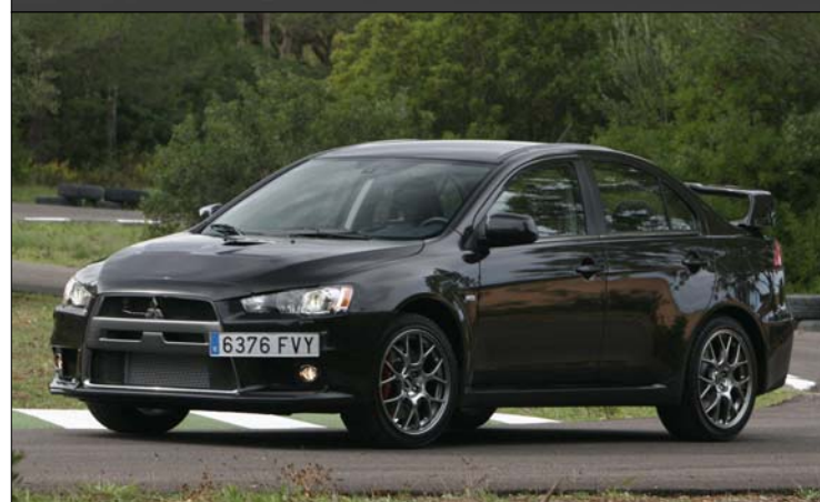
De haut en bas : La Lamborghini Aventador LP700-4 Le ravissant concept Jaguar B99 par Bertone La future défunte Mitsubishi Lancer Evolution X