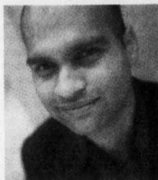
L'auteur indien Aravind Adiga

Balram raconte sa vie : son départ du village vers Delhi, là où il veut réussir, et les moyens pour atteindre son rêve, comme d'assassiner son patron! Dans son premier roman qui vient de remporter le Booker Prize — le plus prestigieux prix littéraire anglophone —, Aravind Adiga adopte le point de vue d'un homme pauvre qui veut s'enrichir.