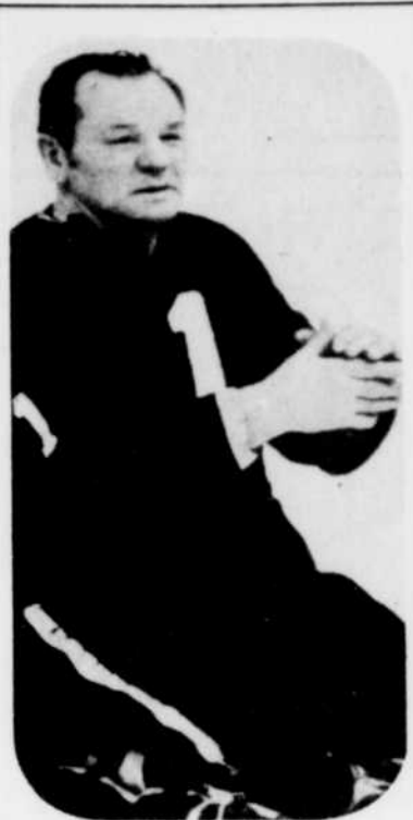
Johnny Bower a repris l'entraînement.