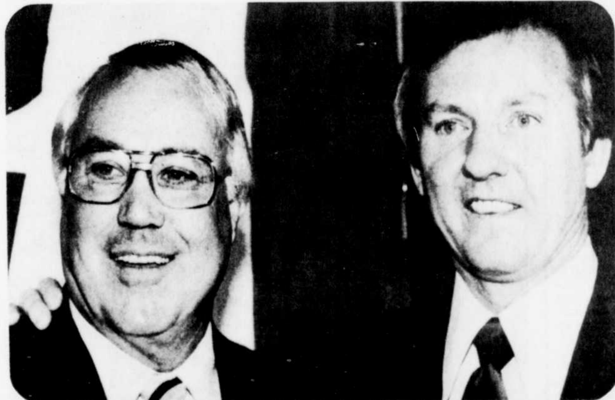
Duke Snider et Al Kaline ont rencontré les membres de la presse, hier, à New York, après avoir été élu au Temple de la Renommée.

cussions qui avaient cours à New York au cours des années '50. Les amateurs comparaient les trois voltigeurs de centre de la région, le Duke à Brooklyn, Mays des Giants et Mantle des Yankees. Ce débat n'est pas encore clos. Mais hier, Snider y a ajouté un autre candidat.