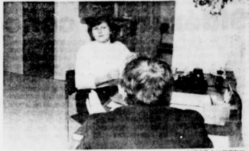
Le Soleil, Jean Vallières

ponsable: "Tout parent en situation d'affrontement avec son enfant, peut nous téléphoner à 648-8251, de 9h à 11h, le matin, de 13h30 à 16h30 l'après-midi et de 19h à 21h30 le soir. En fait, Entraide-Parents c'est un service que les parents se sont donné à eux-mêmes pour éviter un comportement abusif", achevait Mme Noël qui a trois enfants, M. Lord, lui en a deux.