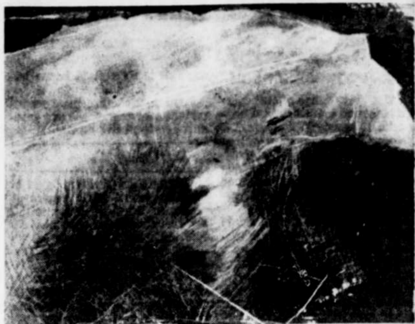
Une partie d'un dessin de Lucienne Cornet

Aimer naviguer entre le dessin et les objets, l'artiste s'est plu à composer des objets intrigants, où pinceaux, papier-calque et bois de faux-cadre s'allient à de la fourrure ainsi qu'à de curieux éléments métalliques. Ces assemblages ficelés, ces simulacres de pièges n'ont toutefois pas été assez efficaces pour retenir deux loups "féroces"... faits de contre-plaqué, qui surveillent étroitement le visiteur, immobiles entre deux colonnes au deuxième étage de la Galerie. Alors... faites attention!