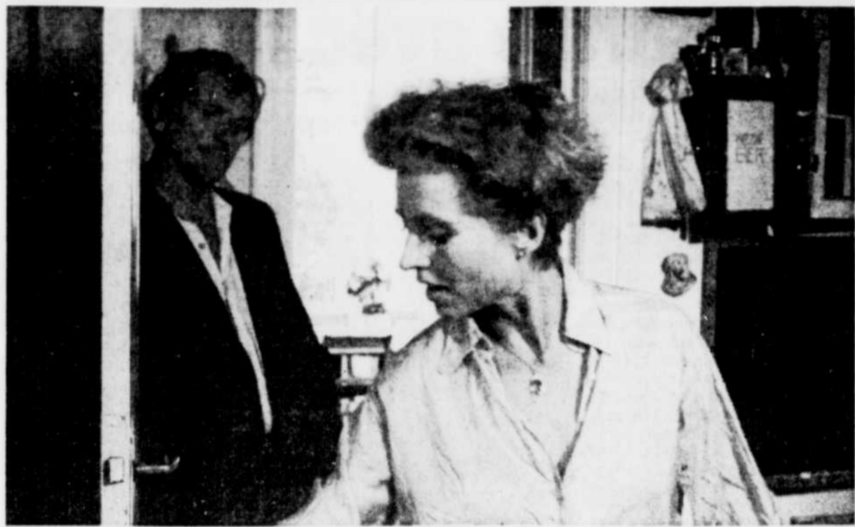
Hanna Schygulla et Peter Striebeck dans "L'amie".