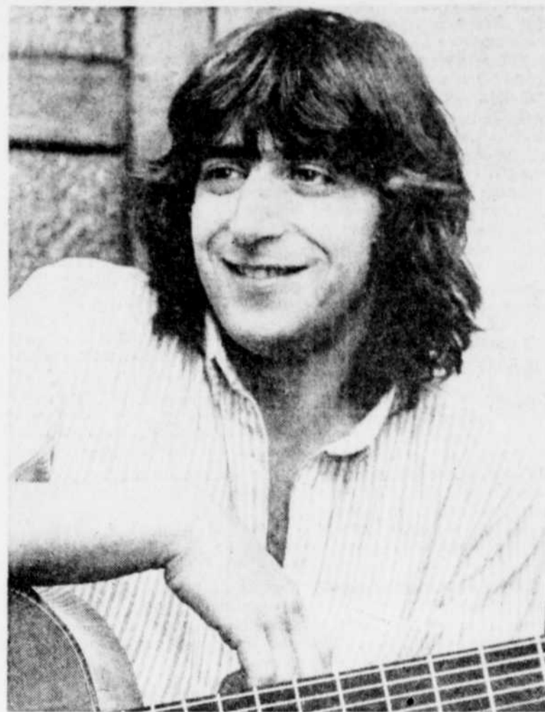
Yves Duteil en est à sa troisième visite au Québec, mais pour la première fois il y chantera sur scène, mardi, à la salle Albert-Rousseau.

Il fait tout donc pour continuer d'être heureux, même si ce n'est pas la mode.