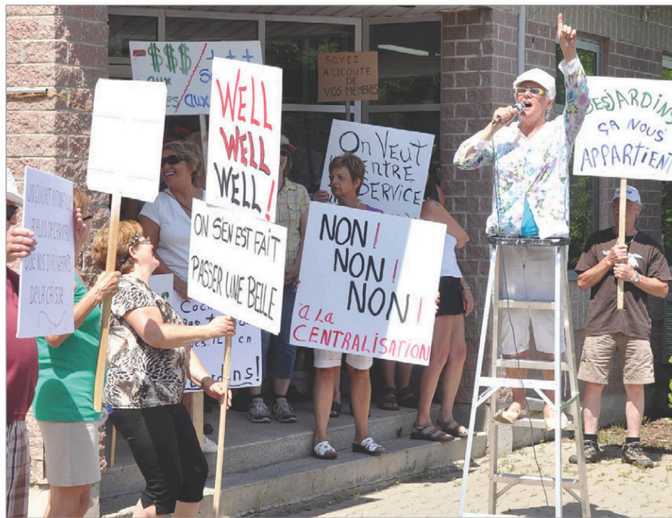
Des pancartes lançaient des messages très importants aux dirigeants de Desjardins.