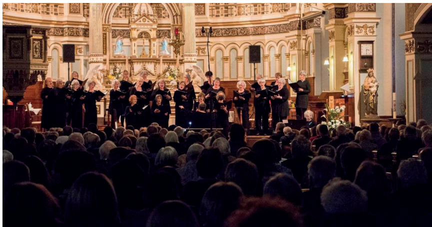
Les Chante-Dames en concert le 19 novembre 2023

Une première répétition avec tous les effectifs, chœurs et musiciens, aura lieu en septembre.