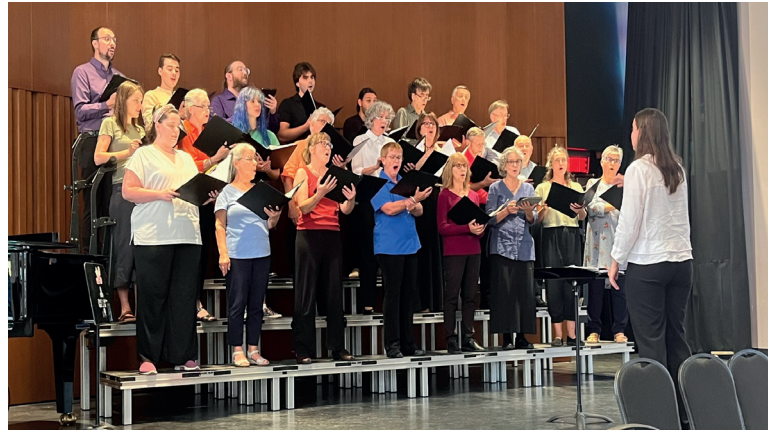
Les stagiaires ont l'occasion de diriger le chœur témoin pour mettre en pratique leurs apprentissages.

Ce fut à nouveau une magnifique expérience que cette semaine de formation. Nos stagiaires, provenant de la Côte-Nord, du Bas-Saint-Laurent, de l'Abitibi-Témiscamingue, de Niagara Falls, de la Montérégie et de Montréal, ont pu progresser à grande vitesse tout au long de la semaine et repartir dans leur coin de pays avec leur besace pleine de nouvelles connaissances qu'il et elles pourront utiliser tout au long de la nouvelle année et de leur carrière en direction.