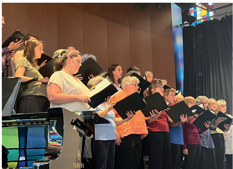
Les stagiaires ont pu compter sur un chœur témoin solide et motivé.