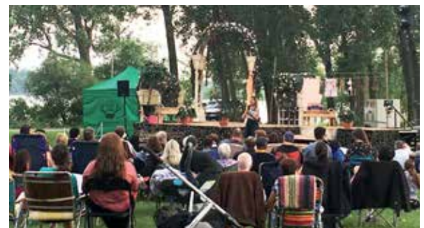
Du 5 juillet au 23 août 2017, 13 événements se sont déroulés en plein air dans les parcs de LaSalle dans le cadre de Culture en cavale.

Inauguration of parc Riverside shelter and pool on July 10.