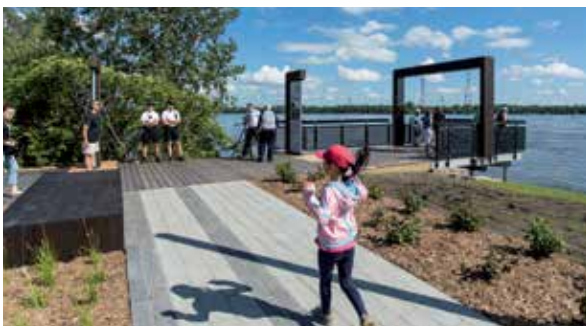
Inauguration du parc Marie-Claire-Kirkland-Casgrain, legs du 375 e anniversaire de Montréal, le 2 juillet 2017.

Québec National Holiday celebrations at parc des Rapides on June 24.