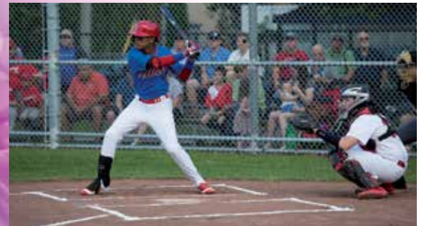
Rencontre entre l'équipe nationale de baseball junior de Cuba et les Cardinals de LaSalle de la Ligue de Baseball Junior Élite (LBJEQ) au stade Éloi-Viau, le 3 juillet dernier.

LaSalle was the scene of cultural, sports, recreational and leisure activities and all kinds of other fun this summer to offer you loads of entertainment and amusement all throughout the season. A number of highlights provided an opportunity to make the most of neighbourhood life.