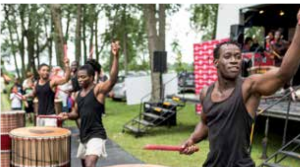
3 e édition du Festival de la S.O.U.P.E (Symbole d'ouverture et d'union des peuples) au parc des Rapides, le 1 er juillet 2017.

The July 2 inauguration of parc Marie-Claire-Kirkland-Casgrain, a legacy of Montréal's 375 th anniversary.