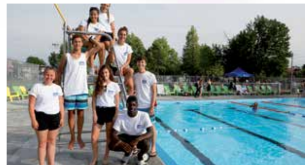
Inauguration du chalet et de la piscine au parc Riverside, le 10 juillet 2017.

Game between Cuba's National Junior baseball team and the LaSalle Cardinals of the Junior Elite Baseball League at stade Éloi-Viau on July 3.