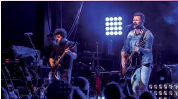
Célébration de la Fête nationale du Québec au parc des Rapides le 24 juin 2017.

Québec National Holiday celebrations at parc des Rapides on June 24.