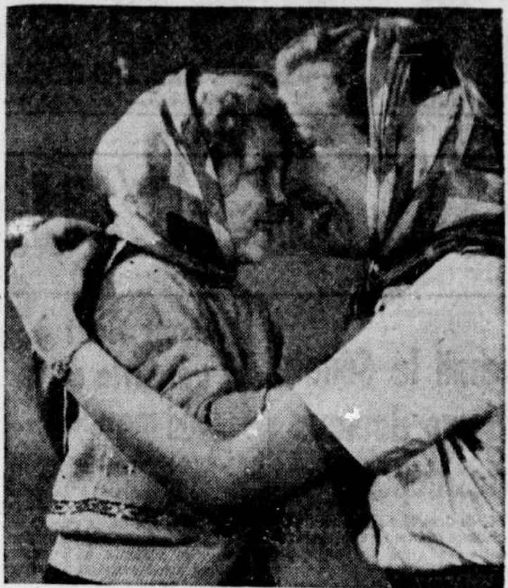
POUR LA PETITE COMME POUR LA GRANDE! — La grande sœur et la benjamine ou la maman et sa petite porteront avec plaisir le même modèle de foulard de soie à carreaux. Ces foulards ont 36 pouces carrés de dimension et sont ourlés à la main. Ils sont vendus en un choix de six couleurs différentes.