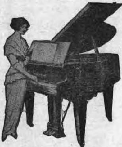
Oh! ces gammes... que c'est difficile!...

Le "Transpositeur" est une très ingénieuse et très utile invention, par laquelle, l'enseignement ou l'étude des gammes et des accords devient chose désormais très facile.