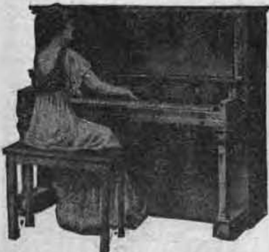
Si j'avais donc connu plus tôt le "Transpositeur".

Le prix du "Transpositeur": 50 cts l'exemplaire; $4.80 la doz.