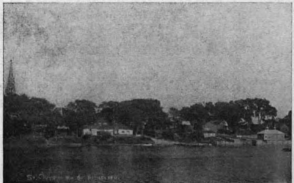
VILLE DE ST-OURS-DE-RICHELIEU

On ne connaît un ami qu'un jour, Où l'on a besoin de lui.