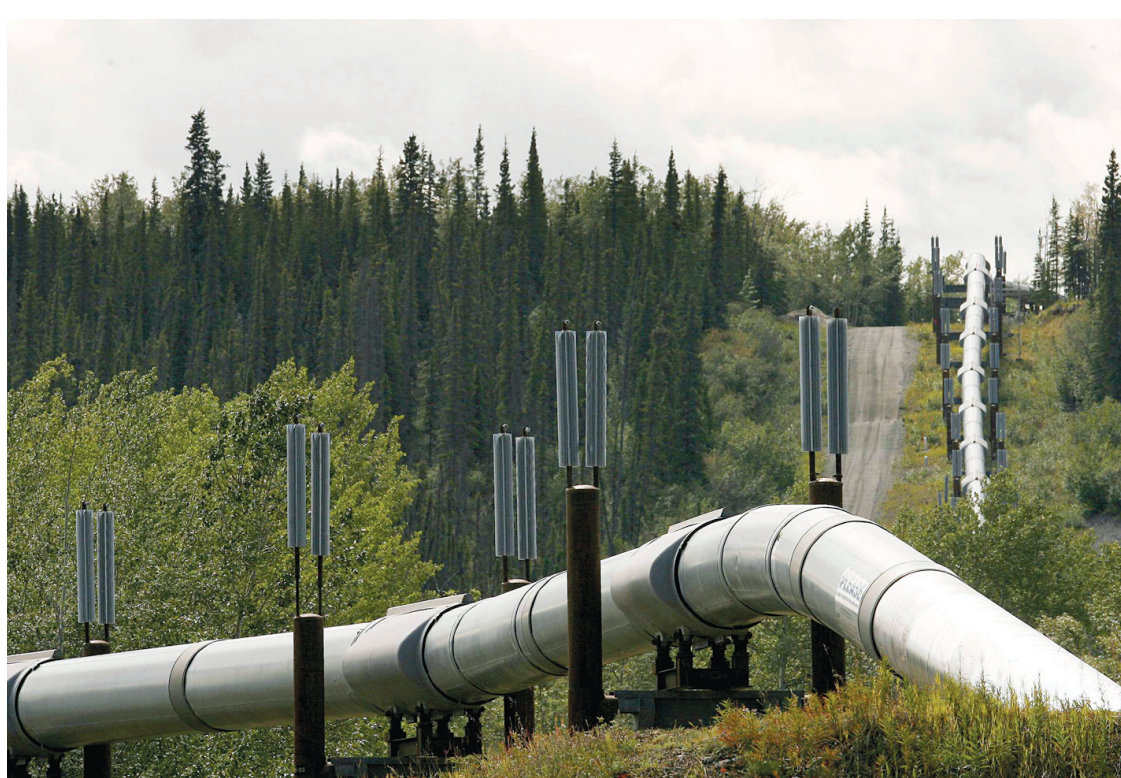
Les pipelines transportant du bitumen seraient plus à risque de fuites, selon une étude.

Or, selon l'étude d'Environmental Defense, le projet réel pose des risques sérieux parce qu'il traverse trois rivières importantes, le lac Ontario et les falaises de Niagara. Le bitumen qu'il trans-