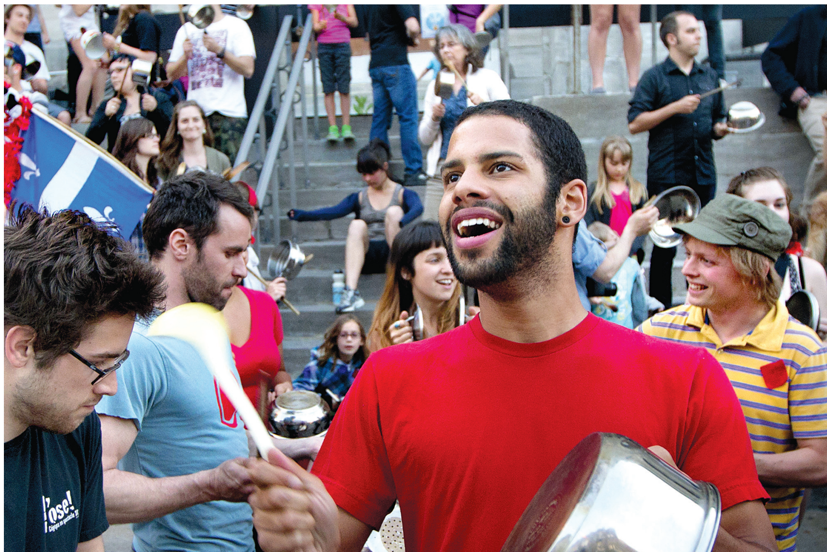
Ils étaient plusieurs centaines à participer hier au tintamarre rue Masson, dans l'arrondissement de Rosemont-La Petite-Patrie, à Montréal.