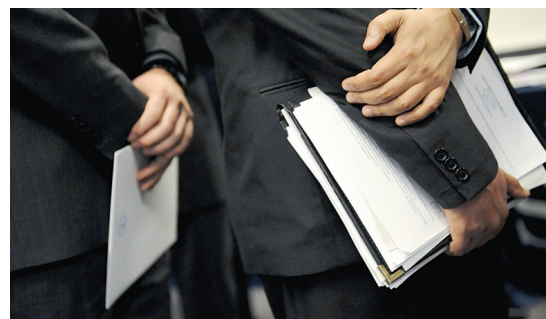
Les titulaires de charges publiques doivent être plus exigeants envers les firmes, selon le commissaire au lobbyisme.

Depuis son arrivée en poste en 2010, le nouveau commissaire au lobbyisme, tout comme son prédécesseur, n'arrive pas à brider les firmes de génie-conseil. Là où tout le monde