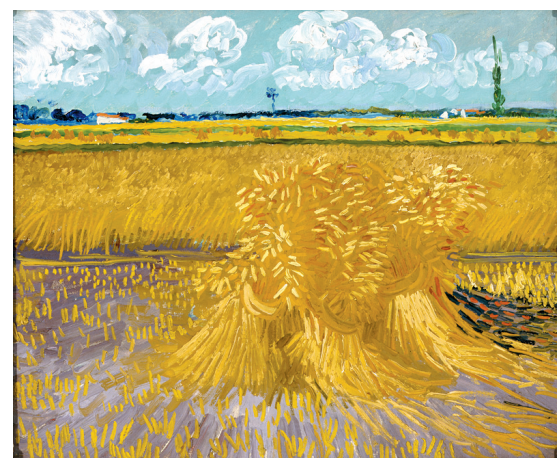
Champ de blé avec gerbes, de Van Gogh (1888)

Le parcours s'intéresse ensuite aux paysages où l'artiste, encore, esquive les conventions en plaçant à l'avant-plan des sujets qui prennent le pas sur le tableau général comme dans Vue d'Arles avec Iris au premier plan (1888). Les diagonales traversent la toile, la ligne d'horizon se défile, la couleur accentue la mise en scène du plan rapproché. Les sous-bois, d'abord impressionnistes, se font de plus en plus expressionnistes, les arbres traversant la toile de bas en haut, laissant le reste dans un flou. Un procédé, qui n'est pas sans rappeler