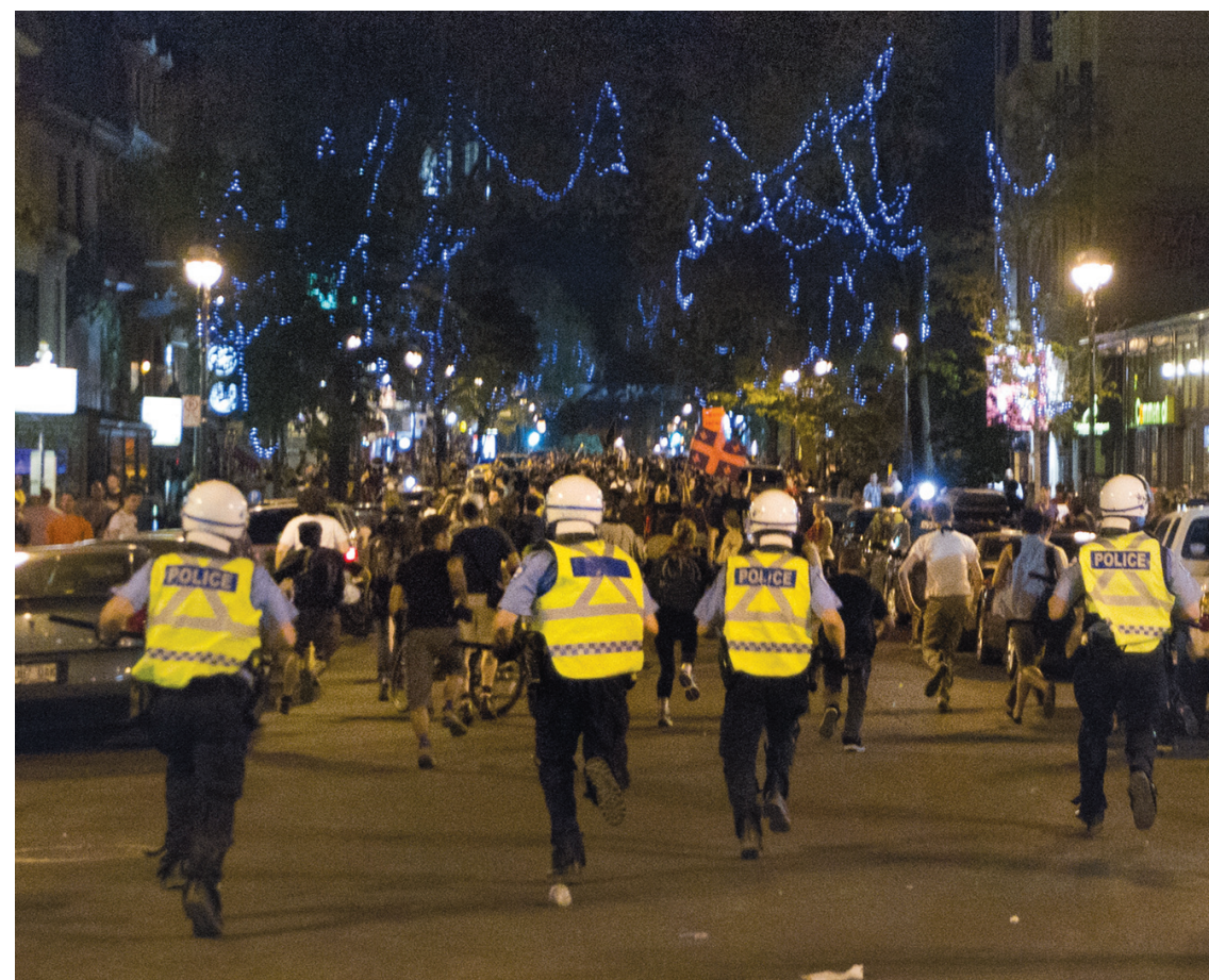
ANNIK MH DE CARUFEL LE DEVOIR Les images de manifestations qui dégénèrent, comme celles des derniers jours, font le tour du monde et nuisent à l'image du Québec à l'international, déplore le Parti québécois.