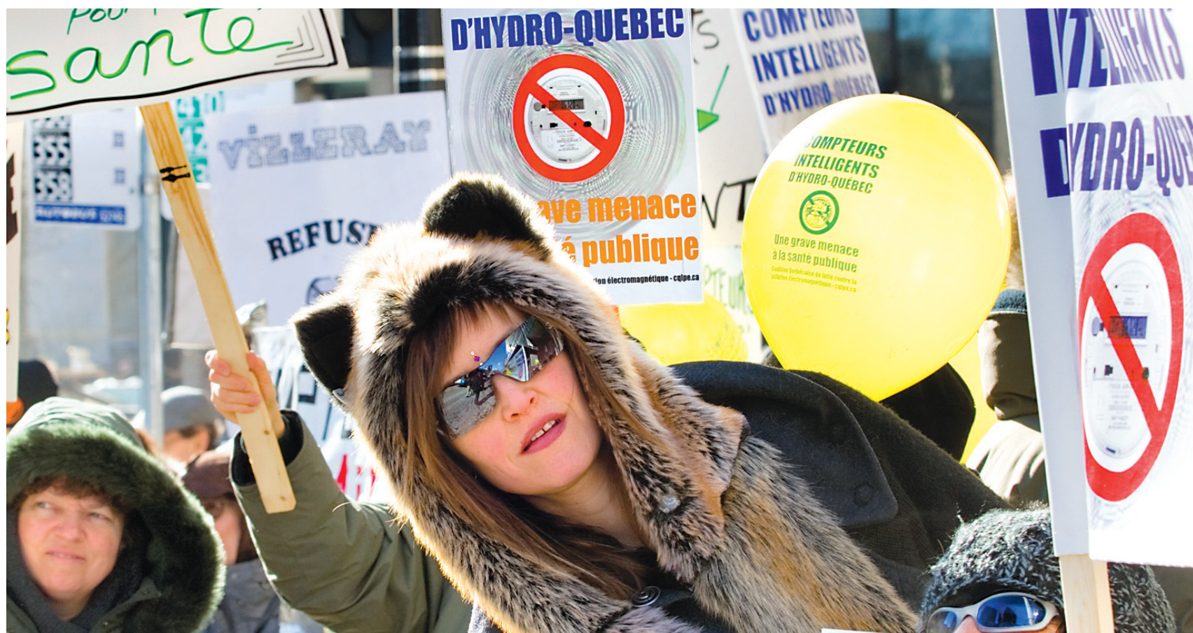
Février 2012. Des citoyens opposés à l'installation des nouveaux compteurs manifestent devant le siège social d'Hydro-Québec. D'autres manifestations du genre ont depuis eu lieu dans la métropole, notamment lors des premiers jours d'audiences devant la Régie de l'énergie.

3. Les normes de sécurité actuelles ne prennent pas en compte les effets biologiques non