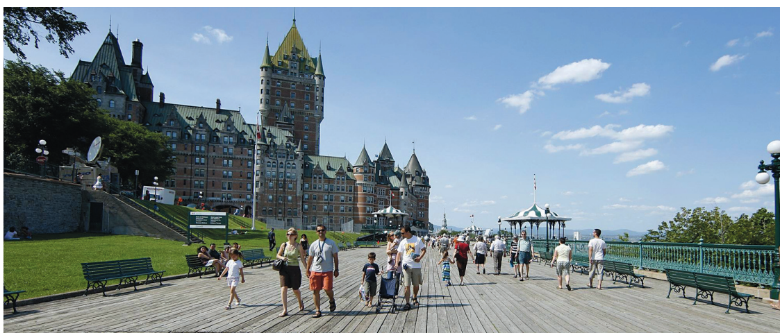
MATHIEU BÉLANGER REUTERS

Par ses attraits comme le Château Frontenac, la ville de Québec est unique, rappelle la FIS.