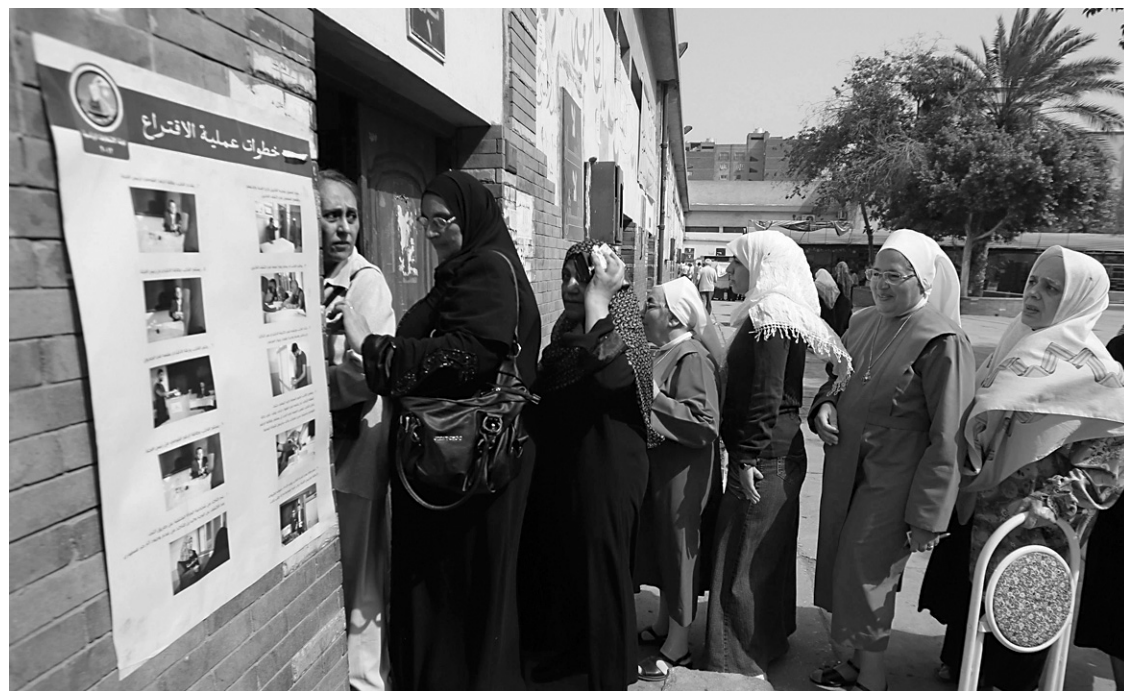
Les Égyptiennes ont fait la file hier pour voter au Caire.

Créer de la richesse, est-ce créer des emplois? La campagne américaine pourrait se focaliser sur le fonctionnement même du système capitaliste. Avec une difficulté particulière pour Barack Obama: le monde de la finance — et en particulier Bain capital — qui avait généreusement contribué à sa campagne de 2008, appréciera-t-il, cette année, ses clins d'œil aux électeurs touchés par la crise et ses piques anti-Wall Street?