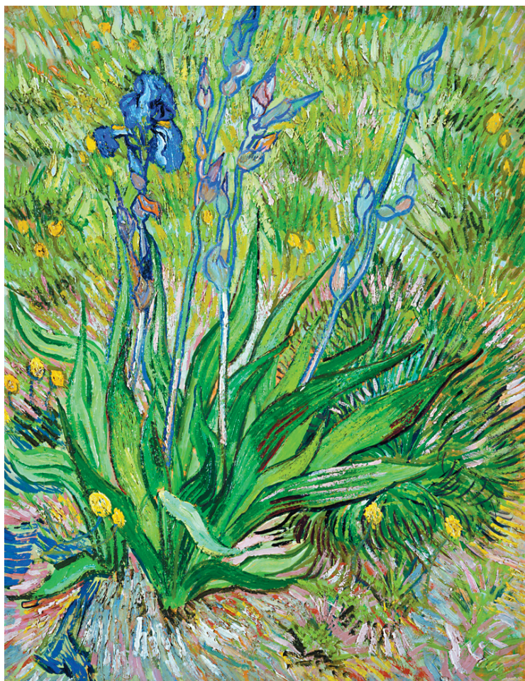
Iris , de Vincent Van Gogh (1890). Au moins le quart des œuvres de Van Gogh exploite la notion de plan rapproché.

Au moins le quart des 2000 œuvres réalisées par Van Gogh dans sa très courte et fulgurante carrière, concen-