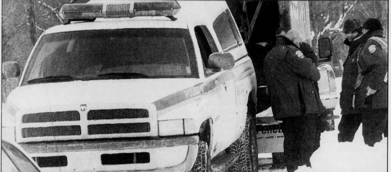
Plusieurs policiers ont ramassé, hier, les 1300 plants de marijuana et les équipements servant à la culture, découverts au 234 de la route 112 à Westbury.