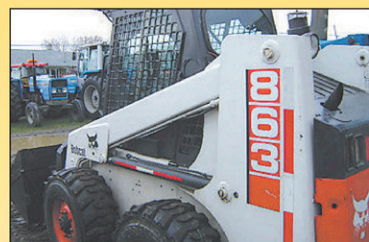
1996 Bobcat 863 Chargeur à Roue 4RM, 2060hr, 73 CV, Diesel, très bonne condition, 1996