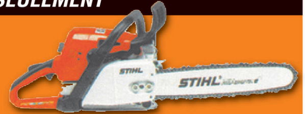
Scie à chaîne à essence MS 290 Garantie de 2 ans • Moteur de 57 cc • Poids 5,9 kg