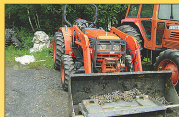
2007 Kioti DK40 Tracteur 4RM, 1300hr, 40 CV, diesel, excellente condition, 2007, chargeur avant, plaque forestière, treuil avant