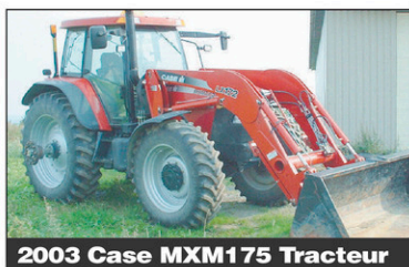
2003 Case MXM175 Tracteur MFD, 1237hrs, 145 CV, diesel, excellente condition, 2003, chargeur, 4 sorties d'huile, valve électronique, roues doubles