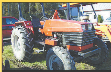
1999 Universal 453 Tracteur 4RM, 1800hr, 45 CV, Diesel, très bonne condition, 1999, 2 sorties d'huile