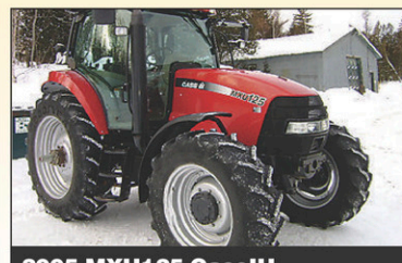
2005 MXU125 CaseIH 4RM, 1950hr, 125 CV, Diesel, excellente condition, 4 s.h., cab sus., essieu bar, ailes avant, val. loa