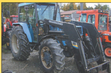
1995 Landini Blizzard 75 Tracteur 4RM, 3570hr, 75 CV, Diesel, très bonne condition