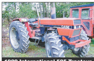
1989 International 585 Tracteur 4RM, 58 CV, Diesel, très bonne condition, 1989, 1 sortie d'huile