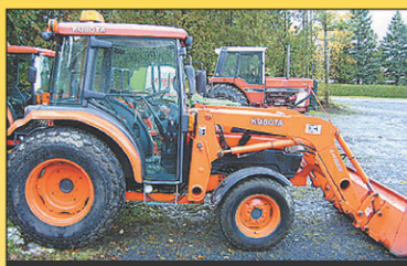
2006 Kubota L5030HSTC 4RM, 1620hr, 50 CV, diesel, excellente condition, 2006