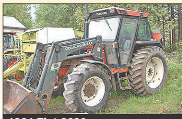
1991 Fiat 9090 4RM, 5400hr, 90 CV, Diesel, très bonne condition, 1991