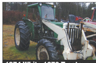
1974 White 1370 Tracteur 4RM, 65 CV, Diesel, Deux roues, bonne condition, 1974, chargeur

2,9% 36 MOIS SUR LES TRACTEURS DE 100HP ET PLUS