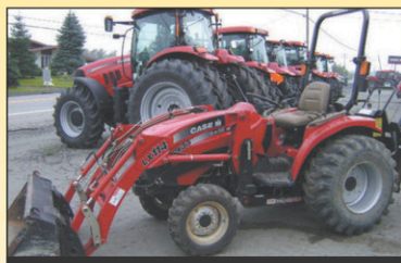
2004 Case IH DX33 Tracteur 4RM, 1400hr, 33 CV, Diesel, excellente condition