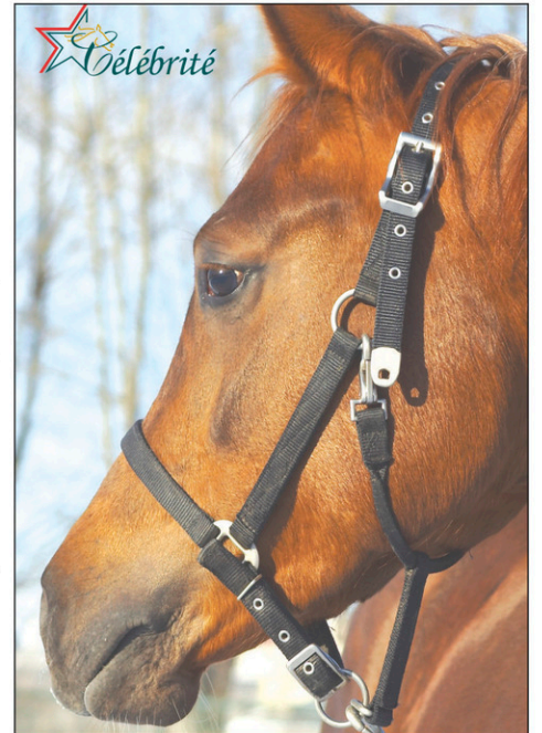
Célébrité Écono-Foin Substitut de foin pour chevaux

Pour plusieurs chevaux, il n'est pas absolument nécessaire de mouiller l'Écono-Foin avant de le servir. Par contre, pour les chevaux qui consomment rapidement leurs aliments, cela permet de créer une fine membrane humide qui empêche l'aliment de coller au palais. Dans ce cas, une simple immersion de quelques secondes suivie d'un drainage rapide est suffisante. D'autres éleveurs augmentent le temps de trempage afin d'amollir le cube dans le but de faciliter l'ingestion par les