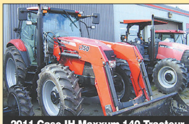
2011 Case IH Maxxum 140 Tracteur 4RM, 200hr, 140 CV, Diesel, excellente condition, 2011, 4 sorties d'huile, chargeur LX750