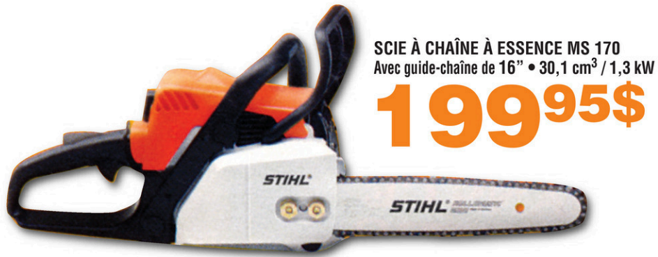
SCIE À CHAÎNE À ESSENCE MS 170 Avec guide-chaîne de 16" • 30,1 cm 3 / 1,3 kW