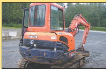
2003 Kubota KX121-3 Excavatrice 4000hr, Diesel, très bonne condition