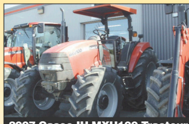
2007 Case IH MXU100 Tracteur 4RM – En tout temps, 100hrs, très bonne condition, 2007, rops