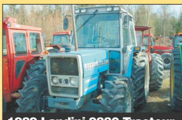
1989 Landini 9880 Tracteur 4RM, 95 CV, diesel, deux roues, excellente condition, 1989, cabine, 4X4