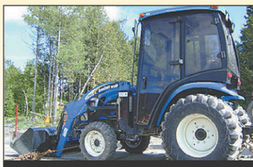
2008 New Holland T2220 Tracteur 4RM, 275hr, 35 CV, Diesel, excellente condition, 2008,