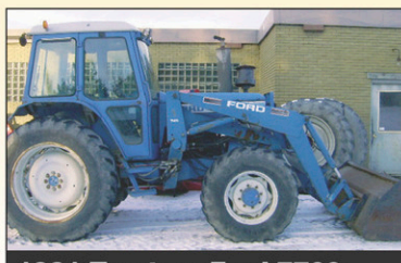
1981 Tracteur Ford 7700 4RM, 7000hr, 70 CV, Diesel, très bonne condition