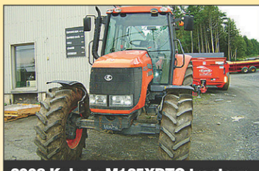
2008 Kubota M125XDTC tracteur 4RM, 230hr, 125 CV, diesel, excellente condition, 2008, 3 sorties d'huile