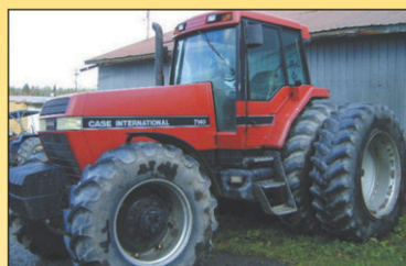
1992 Case IH 7140 Tracteur 4RM, 9000hr, 197 CV, Diesel, très bonne condition