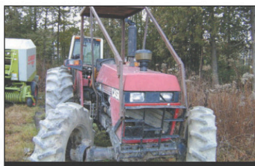
1985 Case IH 1394 Tracteur 4RM, 65 CV, Diesel, très bonne condition