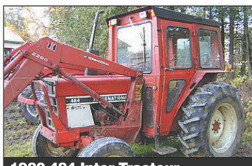
1980 484 Inter Tracteur 2RM, 42 CV, Diesel, bonne condition, 1980, cabine, chargeur, 1 sortie d'huile