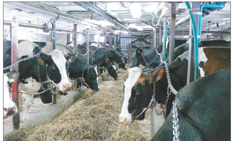
Une trentaine de vache sont présentement en lactation.