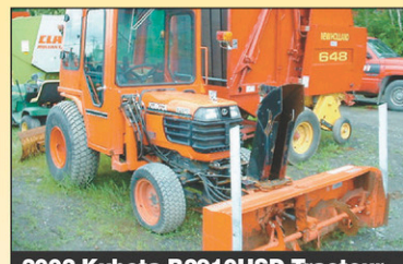
2002 Kubota B2910HSD Tracteur 4RM – Sur demande, 320hr, 29 CV, Diesel, très bonne condition, 2002, MFD, cabine, souffleur frontal