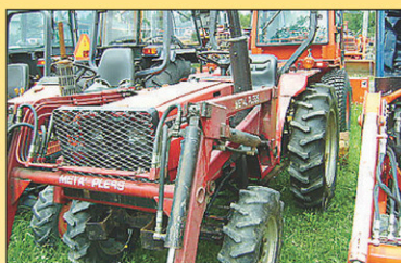
1986 Case IH 254 Tracteur 4RM, 2638hr, 25 CV, diesel, très bonne condition, 1986