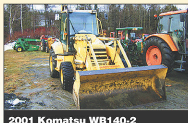
2001 Komatsu WB140-2 4RM, 2800hr, 90 CV, bonne condition, 2001, chargeur, bache