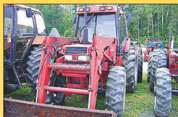
1994 Case IH 895 Tracteur 4RM, 5000hr, 80 CV, diesel, deux roues, bonne condition, 1994, cabine, chargeur