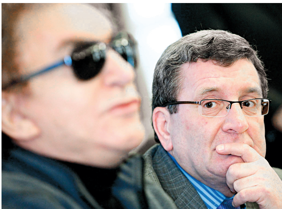
Le ministère des Affaires municipales a fait part cette semaine de ses réserves sur les façons de faire de la Ville de Québec.

des canettes de boisson énergisante et est même allé jusqu'à brandir l'une de ces canettes en plein conseil municipal.