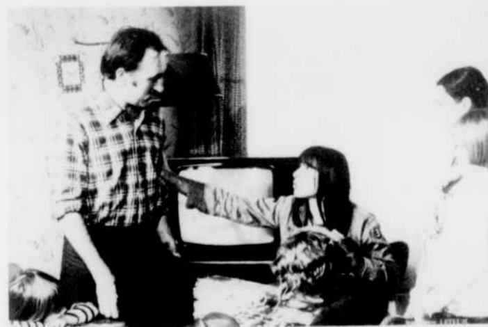
«Millionnaire à froid» avec Catherine Bégin (ci-dessous), Jean Duceppe et Benoit Girard