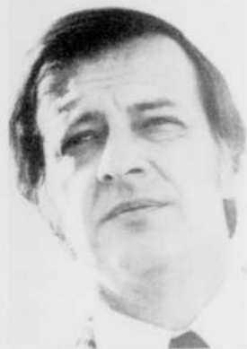
«Patinage artistique». De l'arène du collège Laval. Commentateur: Guy Ferron. Réal.: Raymond Pesant.