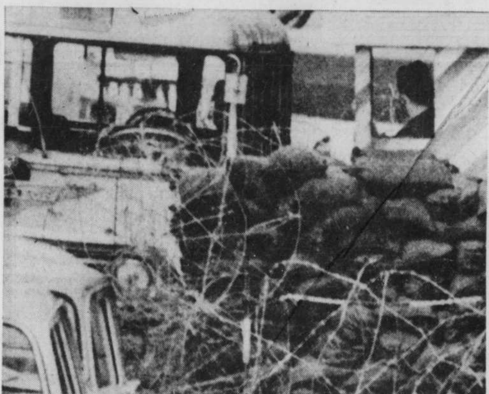
APRÈS UN ATTENTAT OAS