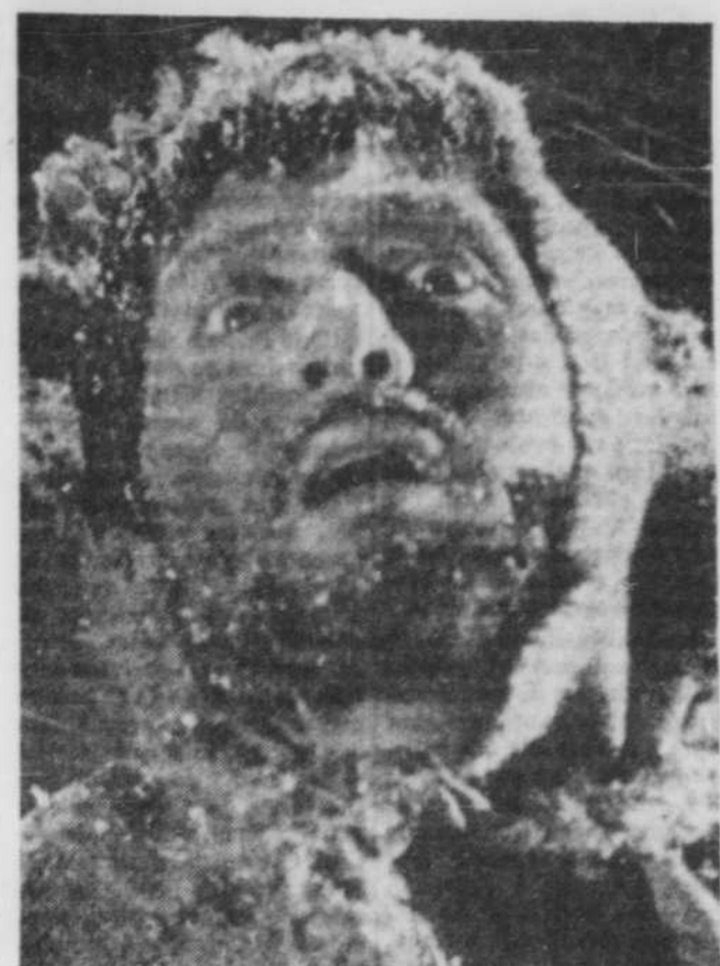
Pourquoi faut-il que la route de l'éternité commence là où finit la vie. “La Condition humaine” de Kobayashi...