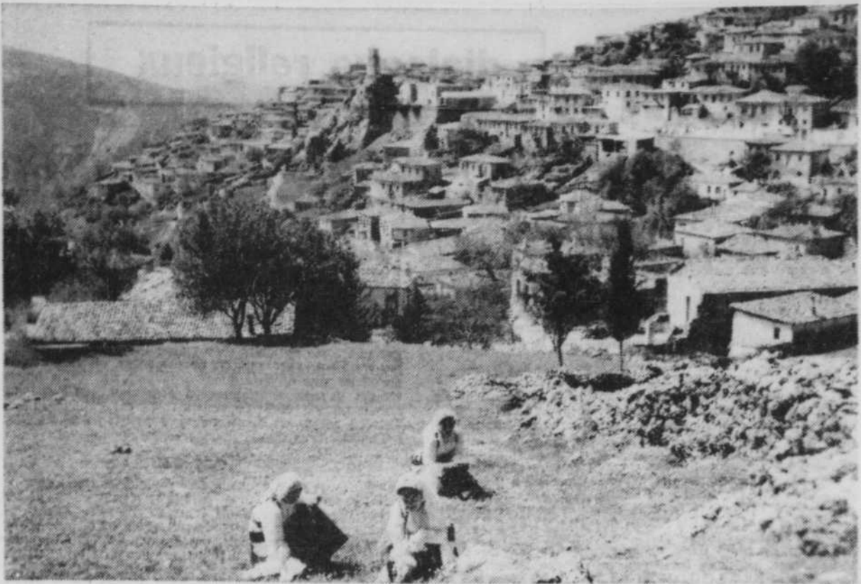
Sur le bateau qui m'éloigne de Grèce je revois, en esprit, ce beau village de la route de Delphes.

Politiquement, en tout cas, la situation se traduit par une perte numérique d'un siège aux communes, puisque le découpage électoral est basé sur le recensement décennal. Une chose saute aux yeux, par exemple: si Québec avait, comme l'Ontario, suivi une politique dynamique encore que sélective d'immigration, au lieu de perdre un siège au cours du prochain découpage, il en aurait gagné deux ou trois. Ainsi, proportionnellement, sa position se serait améliorée au lieu de se détériorer. J'ai suivi d'assez près les débats aux Communes pour savoir que, quelle que soit son origine ethnique, un député de la province de Québec lutte pour les intérêts de celle-ci. Électoralement d'ailleurs, il y est tenu par la force des choses. Il y a bien le problème de l'équilibre ethnique et de l'option des immigrants entre les deux cultures. Mais il serait temps, devant le problème inévitable d'un peuplement plus rapide, de chasser de nos es-