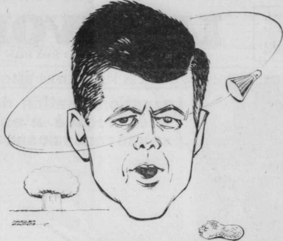
K. :... délibérément, mais à regret