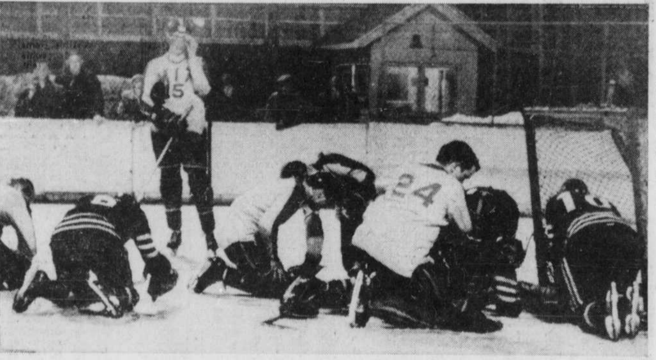
Alions, tout le monde cherche ! Non, non, pas les lunettes d'Uvri, mais le verre-contact qu'un joueur malheureux a perdu au plus fort de l'action lors d'une partie de hockey jouée au Massachusetts !

KITCHENER PC — Le championnat canadien de curling s'est terminé par une triple égalité en première place, hier, nécessitant des éliminatoires hier soir et ce matin. Immédiatement à la fin des 11 rondes, les capitaines de la Saskatchewan, du Manitoba et de l'Alberta ont tiré au sort et la première province est passée en finale contre le gagnant de la rencontre Alberta-Manitoba. La 11e ronde, la dernière de ce tournoi de 10 parties à la ronde, a débuté avec les quatre provinces de l'Ouest sur un pied d'égalité, soit une fiche de 7-2. Le tirage opposait le Manitoba à la Colombie-Britannique et cette dernière a subi l'élimination en s'avouant vaincue 10-7.