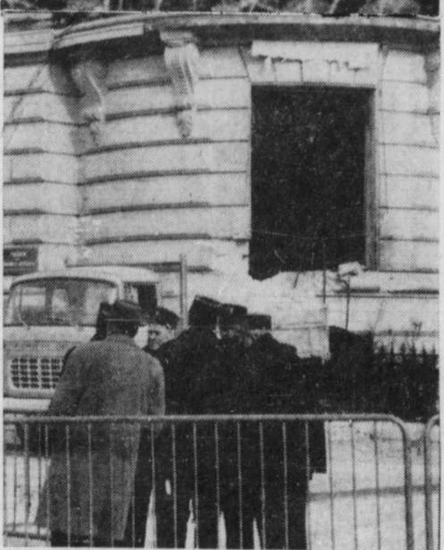
N'entre plus à Alger qui veut. Ci-haut, près de la Place du Gouvernement, un mur de sable et de barbelés oblige automobilistes et piétons à s'identifier. Photo du bas: l'immeuble qui abrite le quotidien "Figaro", au Rond-Point des Champs-Élysées, a été plastiqué par des terroristes de l'OAS. On constate que l'embrasure de la fenêtre est ébréchée.

On avait auparavant décelé une faille dans la digue de terre qui retient l'eau du lac Mégantic, ou la Chaudière prend sa source, à 60 milles au sud de Beaucheville. Si la digue cédait, l'eau du lac, qui mesure 21 milles de long, provoquerait une inondation désastreuse lors de la débâcle printanière. Les opérations de dynamitage se poursuivront durant toute la fin de semaine.