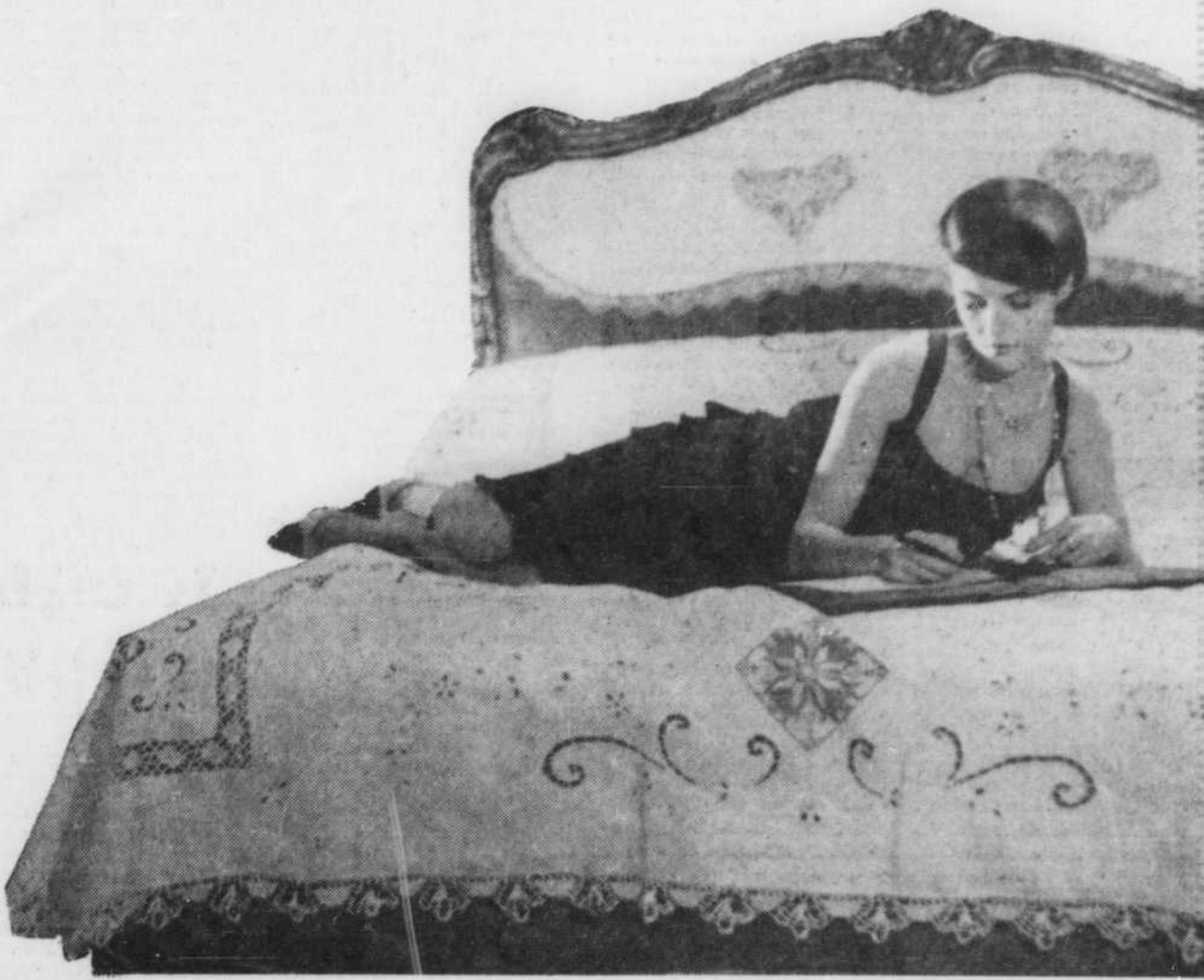
Sans nom précis, simplement appelés par une lettre de l'alphabet, il se pourrait, qu'ainsi distancés, les personnages de "L'Année dernière à Marienbad" aient une signification érotique qui bouleverserait toute l'oeuvre. De même faut-il voir, dans les nombreux bijoux que portent l'héroïne du film, une signification fétichiste? On sait qu'une thèse récemment soutenue à Sorbonne défend l'hypothèse d'un Sonnet des voyelles issu, dans l'esprit de Rimbaud, de la lecture de livres "légers". On connaît également l'oeuvre de Georges Bataille qui va de "L'Abbe C" à "L'Histoire d'O".

Tout art est en équivalence; Alain Resnais a cherché et trouvé quelques rapports qui resteront dans l'histoire artistique du cinéma duquel il aura élargi et la syntaxe et la morphologie. Alors que la nouvelle vague française s'amuse aux citations, ce n'est pas sans méfiance. Citons, nous aussi, la trouvaille qui nous a paru la plus exemplaire: l'héroïne, initialement dans un endroit sombre, sort sur une terrasse ensoleillée; elle porte son avant-bras devant ses yeux, ce que n'importe qui aurait fait, mais, à ce moment là, l'image est surexposée de telle sorte que le spectateur est lui-même ébloui physiquement. Cela n'est rien, cela paraît évident et facile mais cela est neuf, efficace, vrai: plus que du cinéma, de l'art.