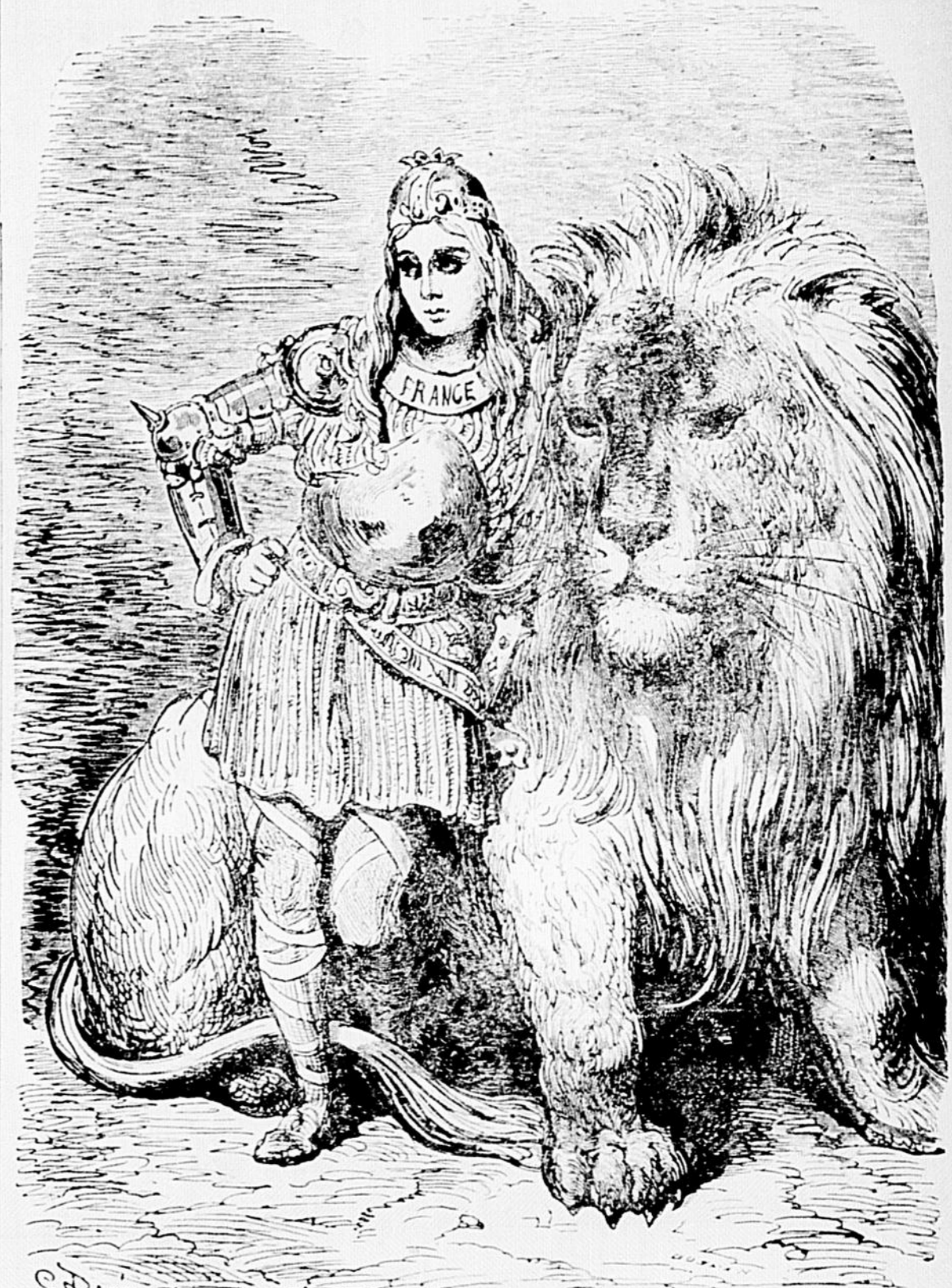
Alliée au Lion britannique, la France est invincible . . .

N'oublions pas que les pompiers sont des soldats sur la brèche d'un bout à l'autre de l'année, et leur vie durant, par quoi ils peuvent être avantageusement comparés aux héros combattant actuellement en Europe sur n'importe quel front.