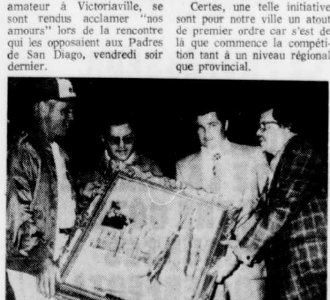
Les responsables du baseball en collaboration avec les Caisses populaires de Victoriaville, étaient de passage au parc Jarry vendredi soir dernier. A cette occasion, on a profité de l'occasion pour rendre un hommage particulier au no 4 des Expos, Gene Mauch. On aperçoit sur la photo, les représentants de la Caisse Pop. M. René Charron (responsable) qui présente à Gene Mauch une peinture.

C'est avec un enthousiasme frappant, que plus de 200 joueurs, instructeurs, arbitres enfin tous ceux qui se sont dévoués à la cause du baseball amateur à Victoriaville, se sont rendus acclamer "nos amours" lors de la rencontre qui les opposait aux Padres de San Diego, vendredi soir dernier.