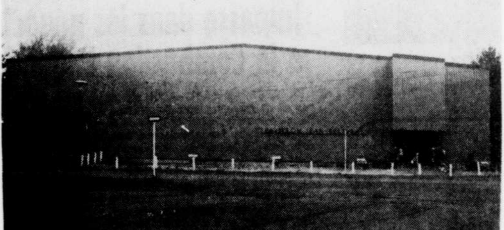
La photo ci-contre fait voir le pavillon Jean-Béliveau, construit au cours de la dernière année par la ville. Ce n'est qu'une des réalisations de la cité.

En résumé Le programme de rénovation urbaine aura radicalement transformé le centre-ville depuis qu'il fut amorcé. Jusqu'ici il aura nécessité des déboursés de l'ordre de payés à 75 pour cent par les $1720,231 somme qui a été gouvernements fédéral et provincial. On prévoit, qu'une fois terminée, le programme aura nécessité des déboursés d'environ trois millions de dollars.