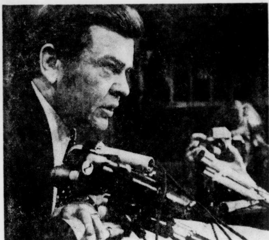
Lundi pas plus tard... au cours d'une conférence de presse, samedi, le ministre du Travail, John Munro, a fixé à lundi, dernier délai, le dépôt des propositions pour une solution au conflit du rail... sinon, il faudra songer à convoquer le Parlement...