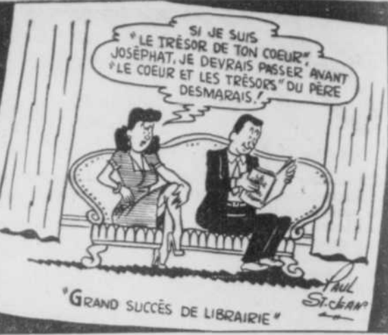
"GRAND SUCCÈS DE LIBRAIRIE"