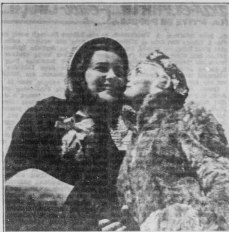
Un baiser à la fois royal et fraternel. Juste avant de s'embarquer à bord de l'un des avions d'Air France, Miss Cinéma a reçu avec le sourire l'accolade de Miss Radio 1951. On dira encore que deux artistes ne peuvent être que deux rivales!...

"Le Roi Cerf" qui devait passer en fin de saison sera donc remis pour une prochaine année. Les abonnés recevront du Secrétariat des Compagnons des précisions à ce sujet. Mais on peut être assuré que "Le Bal des Voleurs" recevra un traitement soigné afin de terminer en beauté une saison qui a connu de belles réussites: Perichon, La Première Légion, Les Gueux au Paradis, La Locandiera, etc.