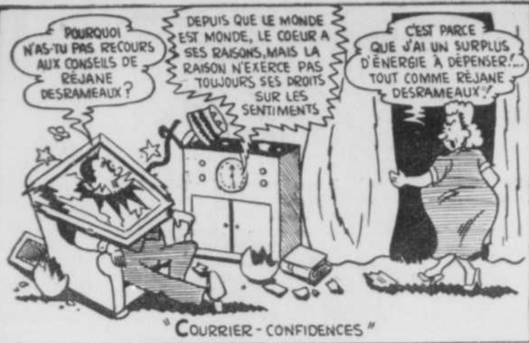
"COURRIER - CONFIDENCES"