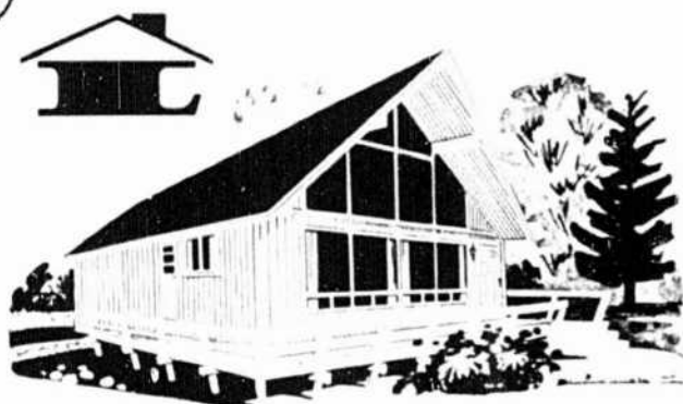
ALPINE $4995 dim.: 24 x 26 (624 pi. car.)