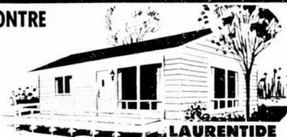
LAURENTIDE dim.: 24 x 16 (384 pi. car.) $1995

10 MODÈLES EN MONTRE PLANS BUDGÉTAIRES Selon vos besoins OUVERT 7 JOURS PAR SEMAINE LAUZANNE 2 étages, dim.: 24 x 24 (1152 pi. car.) $5995