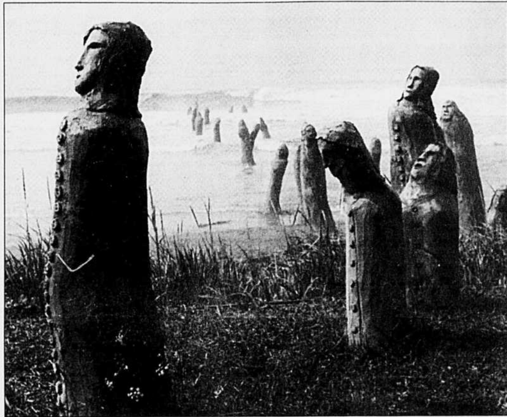
Le grand rassemblement de Marcel Gagnon, à Sainte-Flavie: 80 personnages de ciment et de béton, littéralement sauvés des eaux et à la recherche de la lumière. «Une oeuvre unique au monde qui attire plus de 100 000 visiteurs chaque été», dit son créateur.