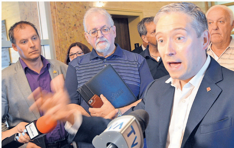
François-Philippe Champagne était de passage dans sa circonscription pour entendre les priorités des élus municipaux dans le cadre de ses nouvelles fonctions.