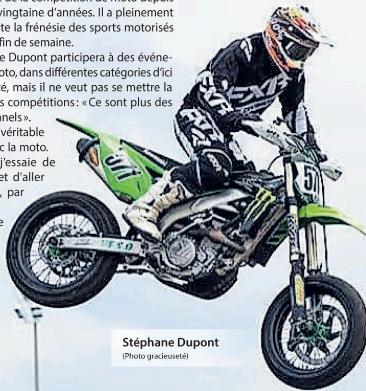
Stéphane Dupont (Photo gracieuseté)