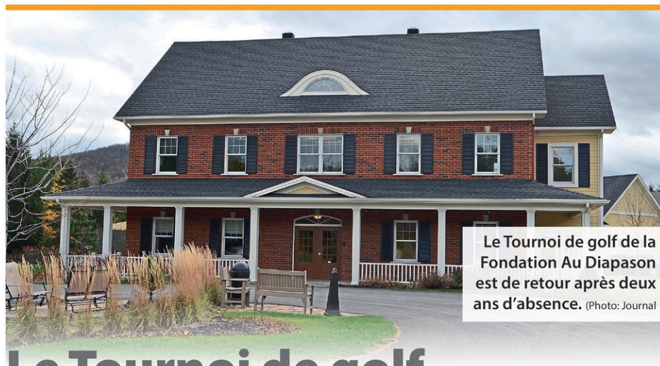
Le Tournoi de golf de la Fondation Au Diapason est de retour après deux ans d'absence.

du côté francophone et anglophone, l'école secondaire Jean-Jacques-Bertrand et l'école secondaire Wilfrid-Léger.