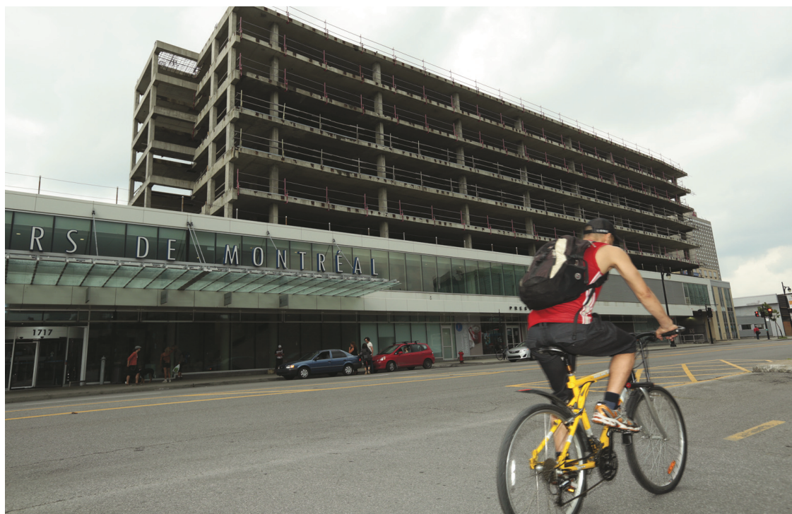
Les étages supérieurs de l'édifice de l'îlot Voyageur seront transformés en logements locatifs et devraient accueillir leurs premiers occupants le 1 er juillet 2016.