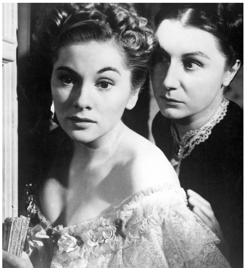
Joan Fontaine tourmentée par Judith Anderson dans Rebecca , le premier film américain réalisé par Alfred Hitchcock, sorti en 1940.

Longtemps illégale en Occident autant qu'en Orient, l'homosexualité fut proscrite à Hollywood en vertu du code Hays qui, entre 1934 et 1954, édicta ce qui pouvait, et surtout ce qui ne pouvait pas, être montré. Ainsi y réglait-on la question de l'homosexualité: « La