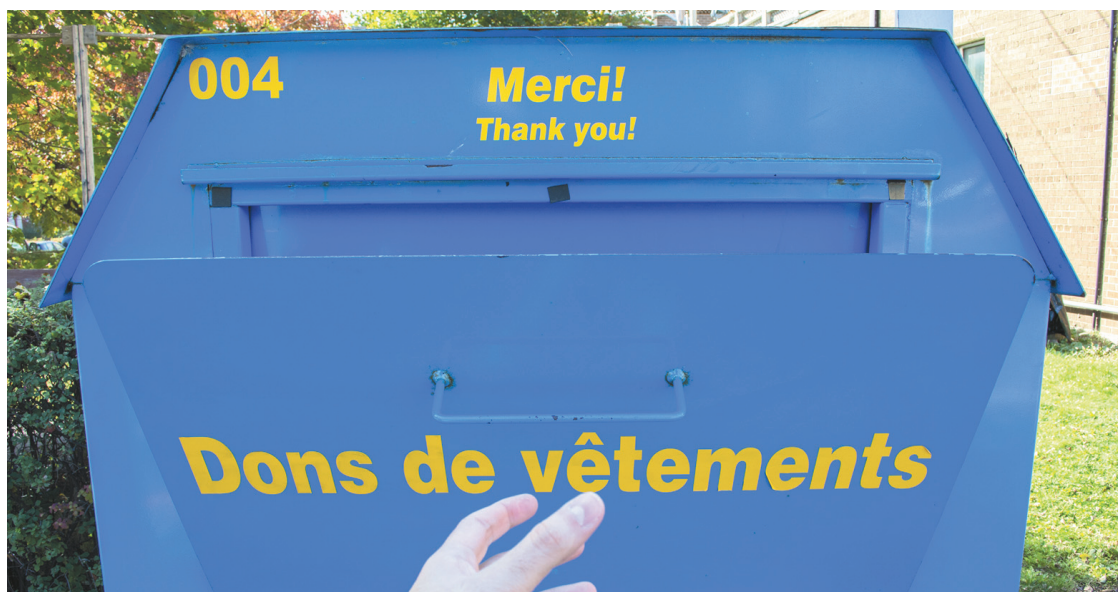
MICHAËL MONNIER LE DEVOIR

Cette réaction correspond à ce qu'entraîne diabétique du Québec a retenu des rencontres organisées avec des représentants du gouvernement l'automne dernier. « On s'attendait à ça », se résigne aujourd'hui la directrice du développement des affaires et des