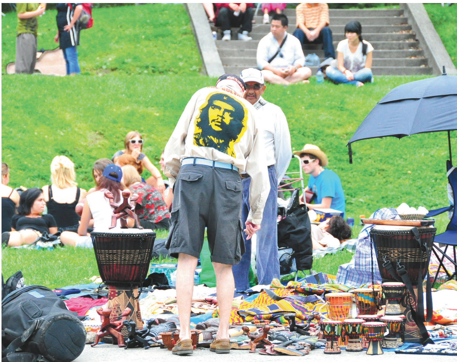
Les Amis de la montagne estiment que l'actuelle tolérance de différents usages interdits favorise leur prolifération.