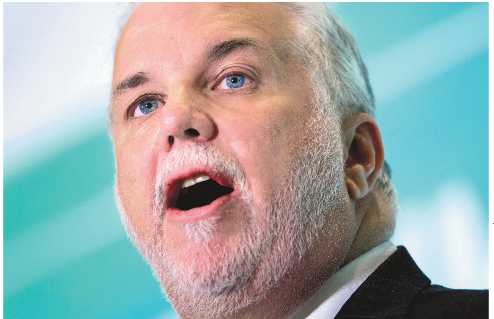
DARREN CALABRESE LA PRESSE CANADIENNE

Québec veut réduire ses émissions de GES de 80 %, mais sonde son potentiel pétrolier