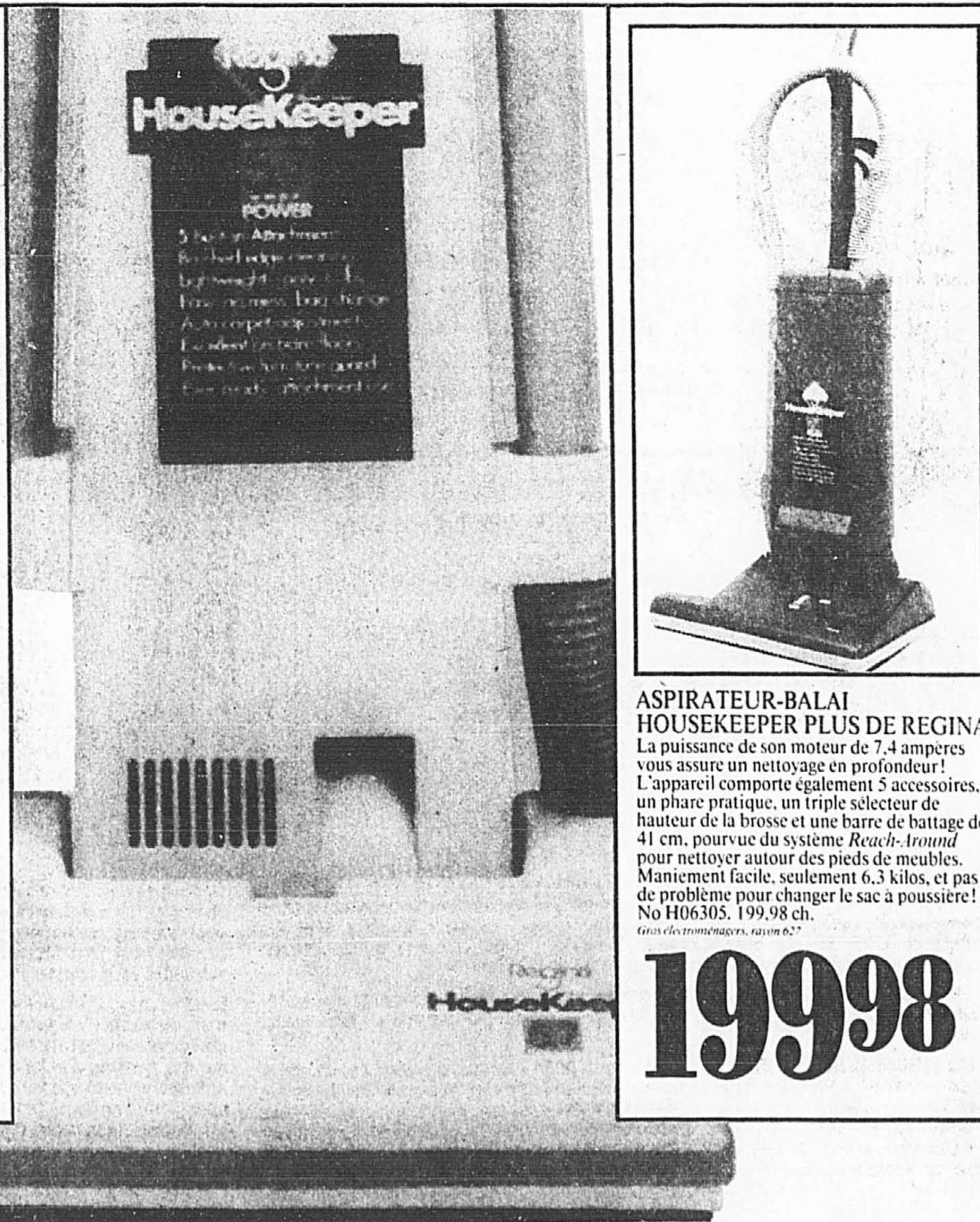
ASPIRATEUR-BALAI HOUSEKEEPER PLUS DE REGINA La puissance de son moteur de 7,4 ampères vous assure un nettoyage en profondeur! L'appareil comporte également 5 accessoires, un phare pratique, un triple sélecteur de hauteur de la brosse et une barre de battage de 41 cm. pourvue du système Reach-Around pour nettoyer autour des pieds de meubles. Maniement facile, seulement 6,3 kilos, et pas de problème pour changer le sac à poussière! No H06305. 199,98 ch.