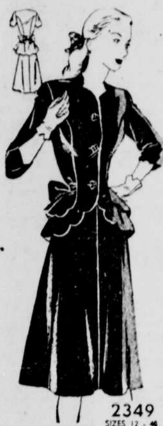
2349 SIZES 12 - 14

Vous serez certaine d'être tout à votre avantage dans ce deux-pièces qui attire une nouvelle attention aux hanches avec son double godet. Voyez comme la manche trois-quarts a des ailettes cette année.