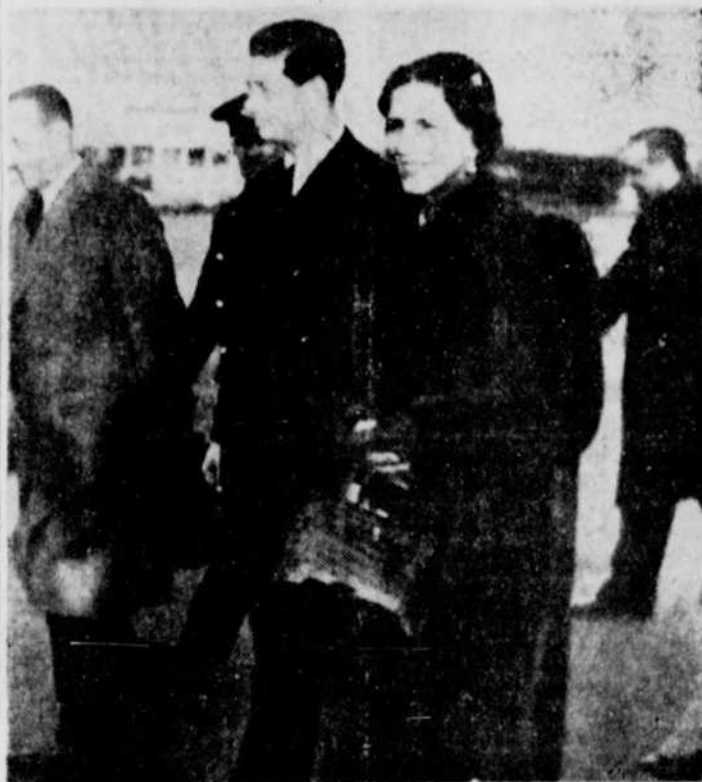
Le roi Michel de Roumanie et sa mère, la reine Hélène, arrivent à l'aéroport de Londres pour assister au mariage de la princesse Elizabeth, le 20 de ce mois. Ils ont fait le voyage à bord de l'avion du jeune monarque, qui pilotait celui-ci.