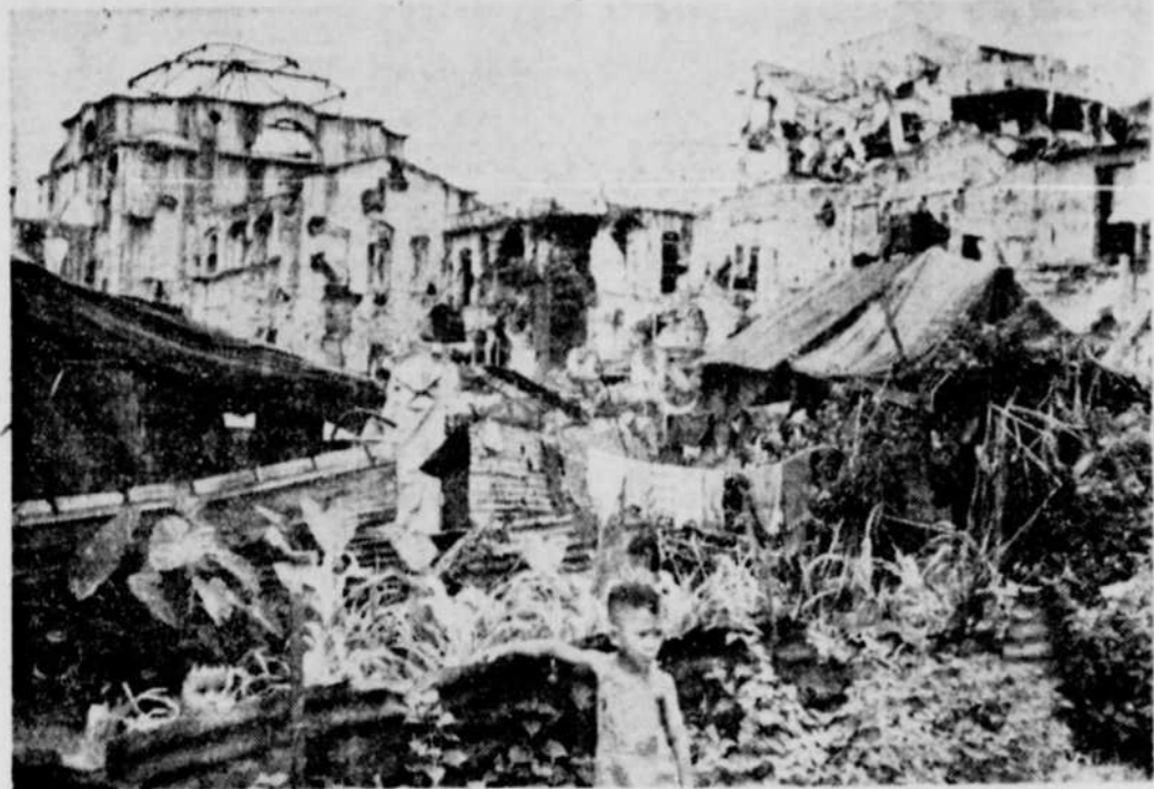
Les gens vivent comme ils peuvent au milieu des ruines de la guerre à Manille. Ce "Hamen" s'est élevé sur les ruines des maisons de rapport du plus important district résidentiel de la ville. Le photographe Bert Brandt, de Acme, a saisi cette scène, au cours d'un voyage autour du monde dans un avion Pan American.