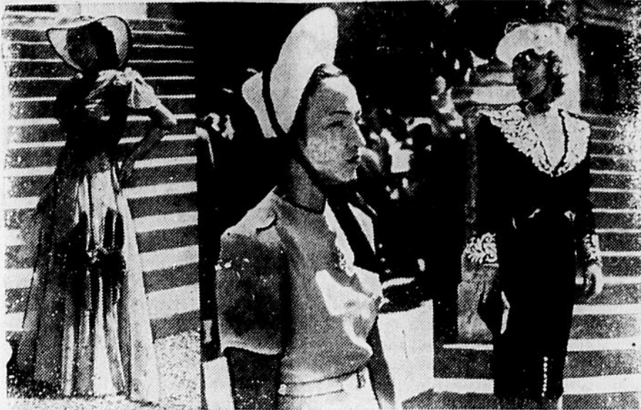
LES MODES A LONGCHAMPS. Voici quelques nouveaux modèles. TRES ELEGANT TAILLEUR REMARQUE AU PESAGE DE LONGCHAMPS. Veste de lainage mauve clair garnie de brun aux manches et aux poches, blouse et chapeau blanc.

Hier, je passais sur la plage. L'heure du bain... un peu éloignée de là, je voyais une dame, une énorme femme qui prenait ses ébats. Une femme immense... et riant de cette forme grotesque, étalée en plein soleil, je demande à mon compagnon: Est-ce une touriste? Non, dit-il, c'est... une tour! Et voilà. Campagne silencieuse, qui te recueille à chaque fin de jour, comme une âme en prière; toi qui chantes sans te lasser les moissons nouvelles, garde-nous; Que ta voix priante, évocatrice des durs labeurs et des joies saintes, couvre le bruit des villes qui déferle de ses routes et pénètre jusque dans nos maisons. Refais pour nos âmes l'éternel geste du semailleur: jettes-y le bon grain et le long des jours qui passent, devant le décor changeant et merveilleux de nos saisons, fais-y fleurir toutes les vertus. Campagne, garde-nous! G. B.