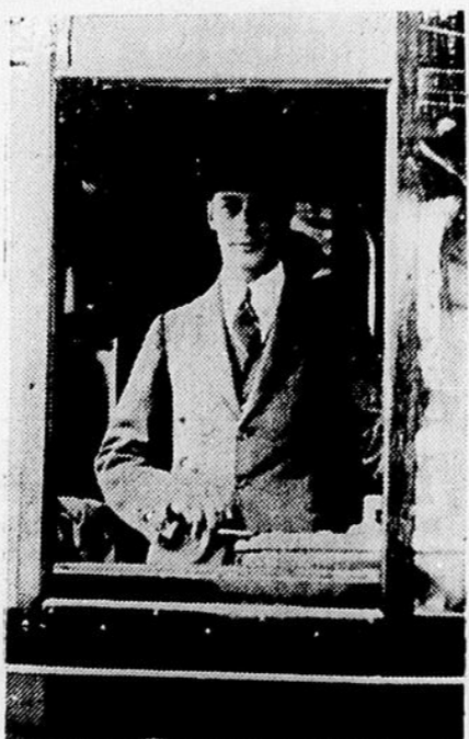
Le roi Georges VI, dont la France prépare activement la visite photographiée ces jours-ci alors qu'il conduisait un tramway dans une ville anglaise.