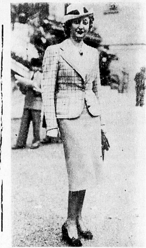
TRES ELEGANT TAILLEUR REMARQUE AU PESAGE DE LONGCHAMPS. Veste de lainage mauve clair garnie de brun aux manches et aux poches, blouse et chapeau blanc.

L'ACTION CATHOLIQUE ET LES RELIGIEUSES par le R. P. Archambault, S. J.