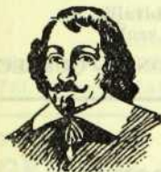
SAMUEL DE CHAMPLAIN