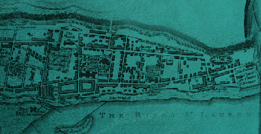
Couverture 1 | L'hôtel de ville de Montréal.

Carte de la ville en 1758. Les fondations sont encore visibles aujourd'hui au Champ-de-Mars.