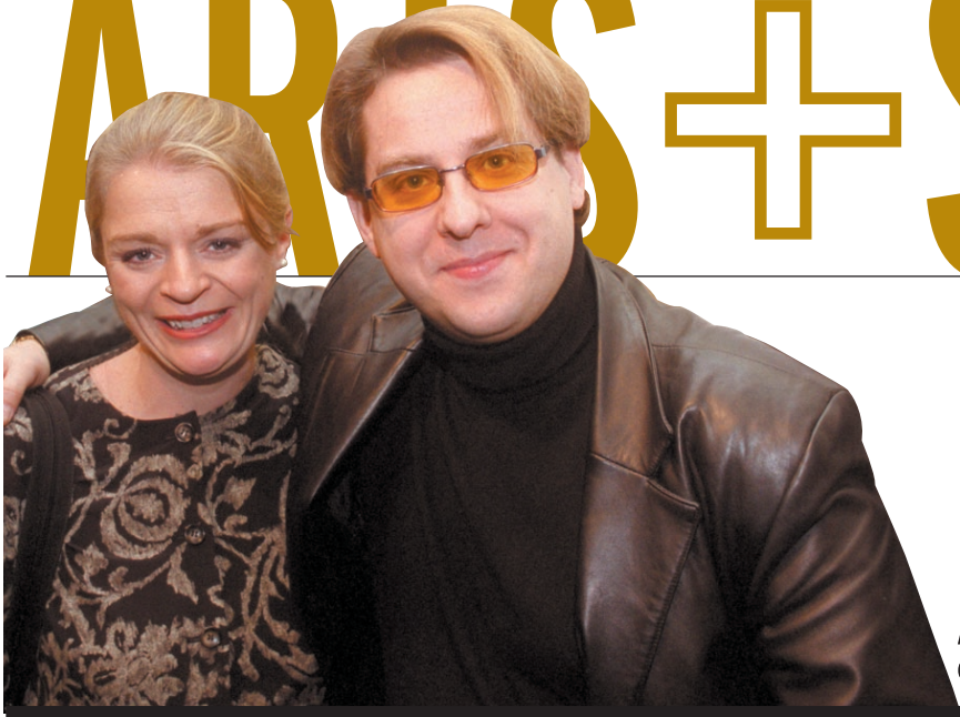
Angèle Dubeau et Alain Lefèvre