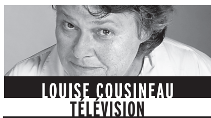
LOUISE COUSINEAU TELEVISION

Documentaire fascinant ce soir à 20 h à Télé-Québec sur la schizophrénie, la perte de contrôle sur la réalité qui affecte une personne sur 100 dans le monde, soit entre 10 et 15 000 Montréalais. Fascinant parce que des schizophrènes témoignent. Ils parlent souvent avec une intelligence remarquable. Ce qui les a poussés à parler à visage découvert, c'est le désir d'être acceptés. « Faut que le monde arrête de rire de nous autres, dit une des jeunes filles. Je ne suis pas un monstre. »