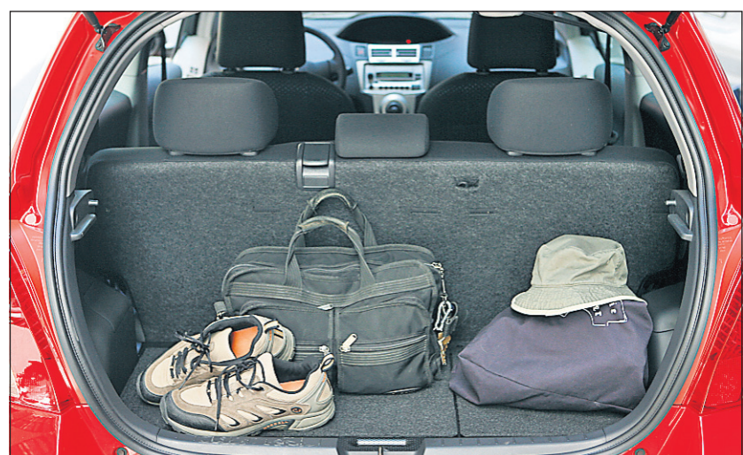
Le coffre de la Toyota Yaris.