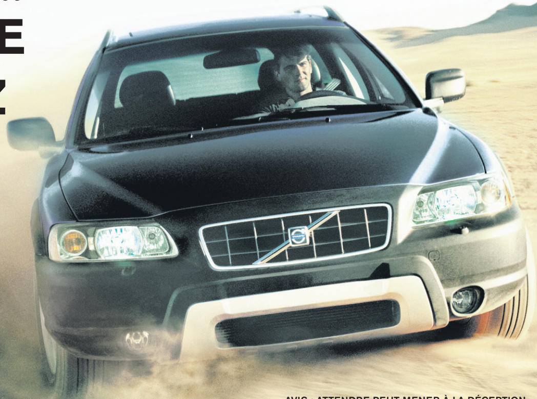
AVIS : ATTENDRE PEUT MENER À LA DÉCEPTION

BAS TAUX DE CRÉDIT-BAIL ET DE FINANCEMENT SPÉCIAUX