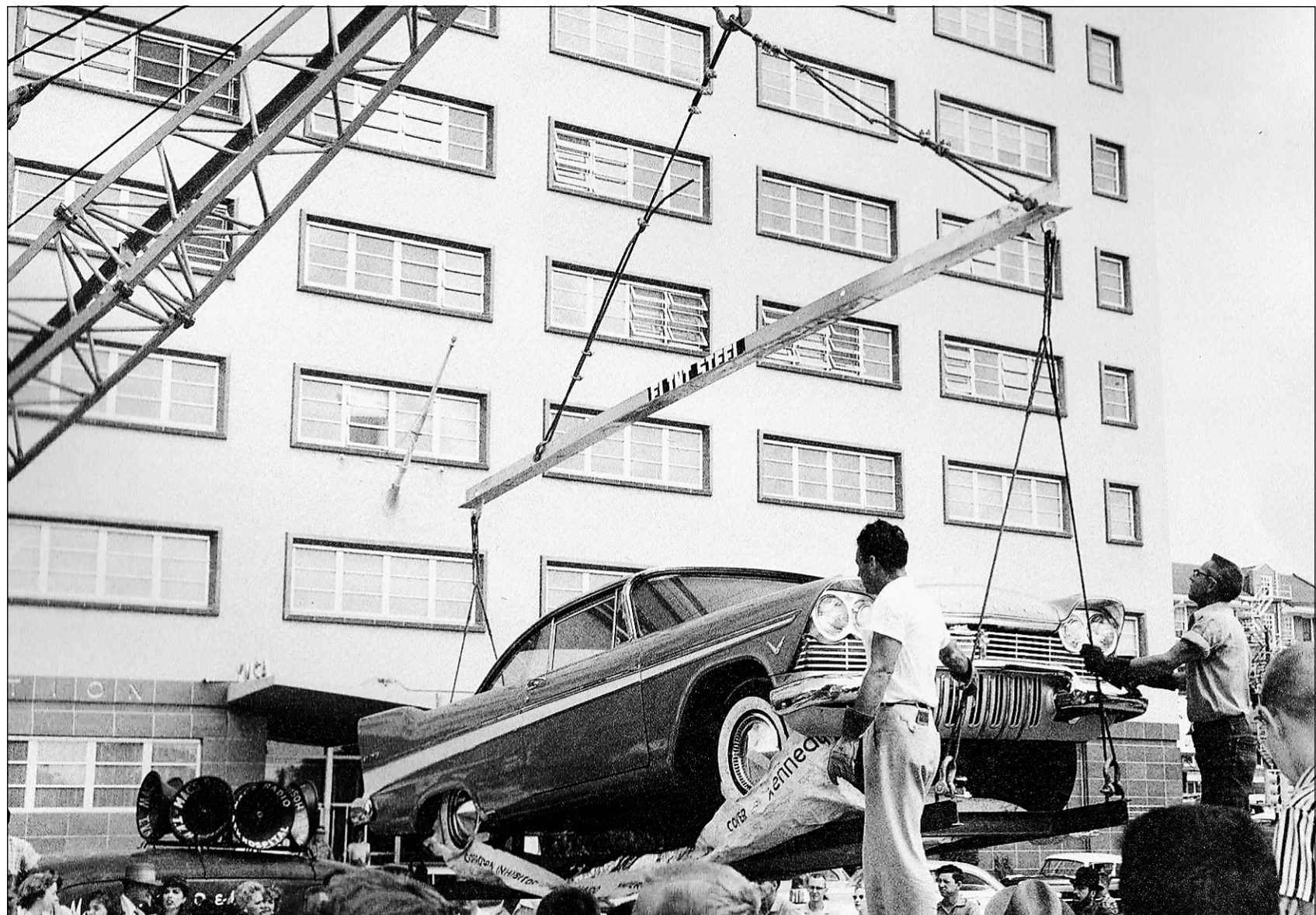
Le coupé Plymouth Belvedere 1957 s'apprête à disparaître sous terre. Sa mission: sortir des ténèbres en 2007 pour le centenaire de Tulsa, en Oklahoma.

Rappelons que la marque Plymouth a été créée en 1928 par Walter P. Chrysler pour servir de solution de rechange abordable aux modèles de la gamme Chrysler. En 1957, Plymouth a construit