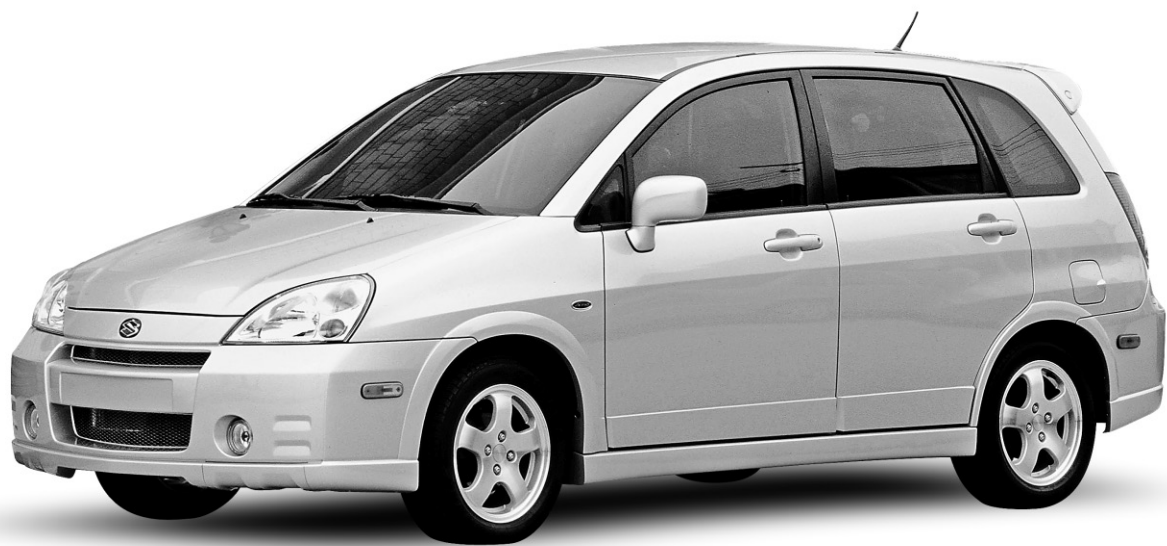
Suzuki Aerio SX 2004