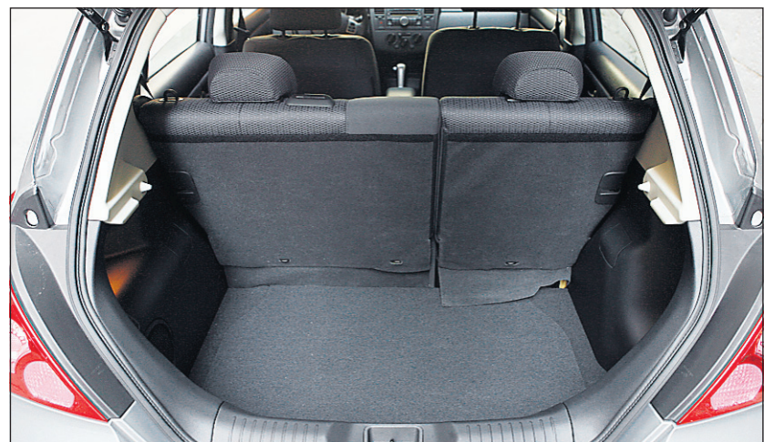
Le coffre de la Nissan Versa.

Au chapitre de l'habitabilité, la Versa propose, et de loin, les places arrière les plus spacieuses, surtout pour les jambes. Avec 966 mm, la Versa propose 107 mm de plus que sa plus proche concurrente, la Yaris. Si la Fit en prend ombrage, elle se rattrape de belle manière en proposant un meilleur dégagement pour les hanches (à l'avant comme à l'arrière) et une garde au toit supérieure (à l'arrière) à celles des deux autres.