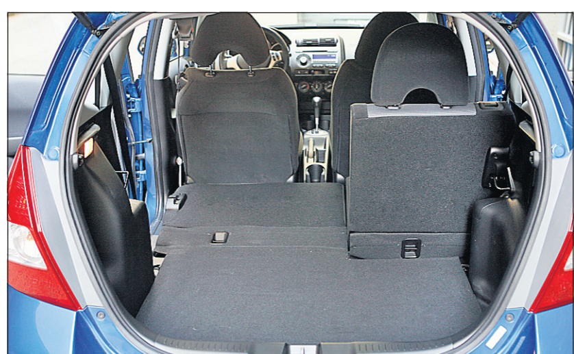
Le coffre de la Honda Fit.