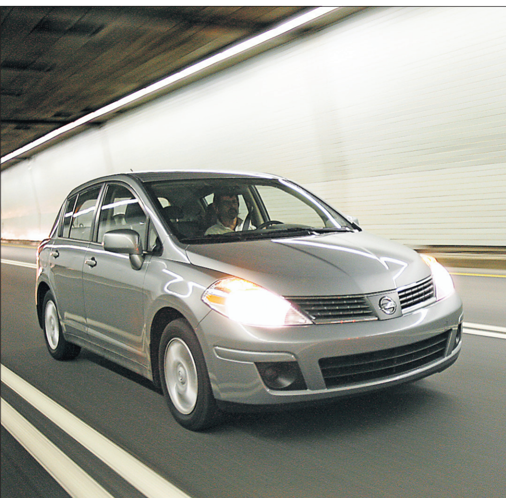
La Nissan Versa.

décentes, un coffre suffisamment accueillant (sauf la Toyota) et modulable grâce au dossier rabattable. Elles ne craignent pas non plus de prendre la route, où elles démontrent d'étonnantes aptitudes. En outre, leur moteur produit plus de 100 chevaux. De quoi offrir, considérant le poids de nos trois candidates, des accélérations honnêtes et des reprises suffisantes pour assurer des dépassements sécurisants. Bref, ces trois petites se disent bonnes à tout faire... et s'annoncent difficiles à départager.