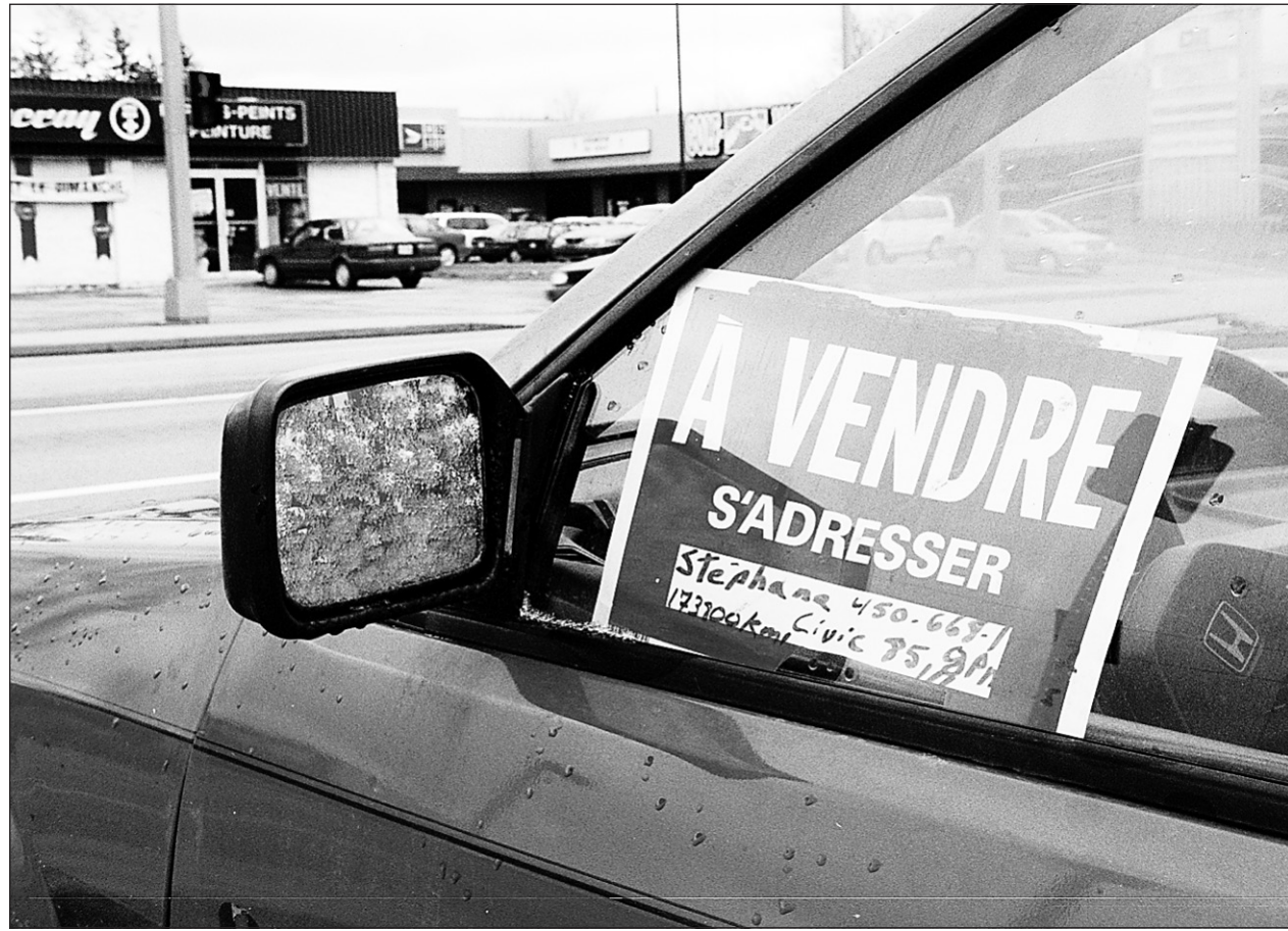
Le Salon des véhicules d'occasion du Québec se déroulera du 5 au 8 octobre au Palais des congrès de Montréal.

« On accepte seulement les gros exposants, comme les membres de l'Association des marchands de véhicules d'occasion du Québec (AMVOQ) et les concessionnaires majeurs, assure-t-il. Il n'y aura pas de minoues. En moyenne, les véhicules datent de 2001 à 2005, donc leur condition est bonne et leur kilométrage est bas. Toutes les marques partici-