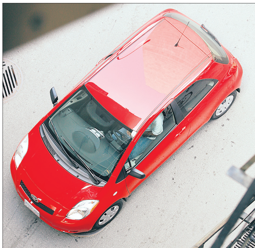
La Toyota Yaris.