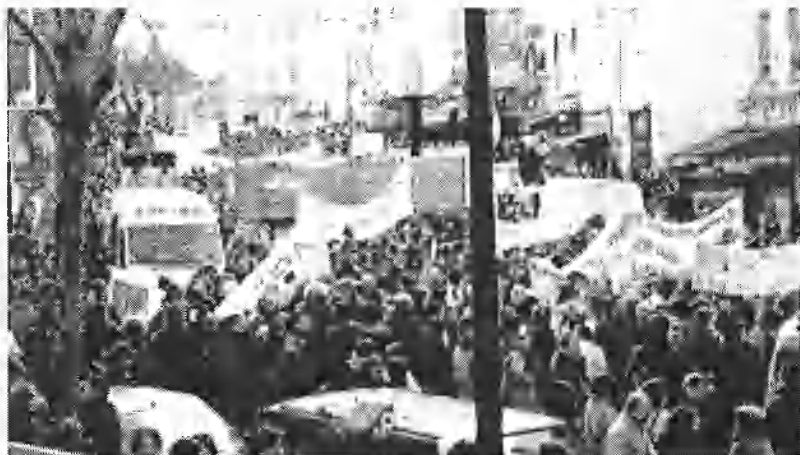
Manifestation à Paris en mars 2004. (Le 9, le 12 ou le 19...)? sauvonslarecherche06@free.fr

Quand vous aurez obtenu satisfaction, serez-vous reconnaissants à la France et défendrez-vous enfin sa langue ou, tout du moins, cesserez-vous de participer activement à son déclin?