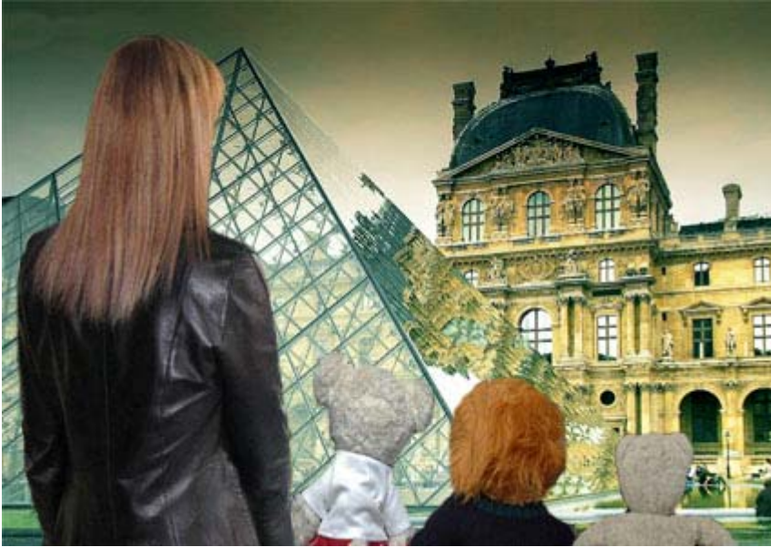
Mademoiselle X et les mascottes, Miss Gym, son frère Monsieur X et Gogueie au Musée du Louvre à Paris..

"Quand on y songe, les grands magasins sont un peu comme les musées!" - Andy Warhol