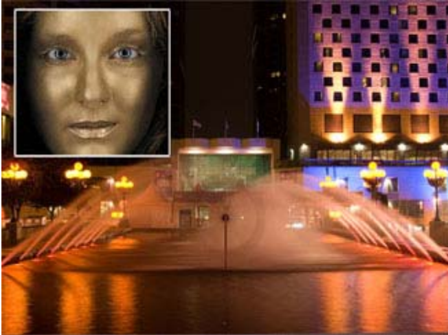
Fontaine extérieur - Opéra de Montréal

L'Opéra de Montréal est redevenu une organisation rentable et la direction envisage la prochaine saison avec enthousiasme. En tout la saison 2008-2009 comprendra à nouveau cinq opéras dont la première production "La fanciulla del West" (La fille du Far West) par Puccini (20 septembre). L'existence de l'Opéra de Montréal avait été sérieusement remis en question à cause d'un déficit accumulé de 2 millions$ (2006).