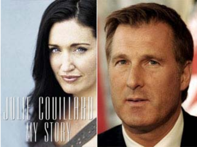
Couverture du livre et Maxime Bernier