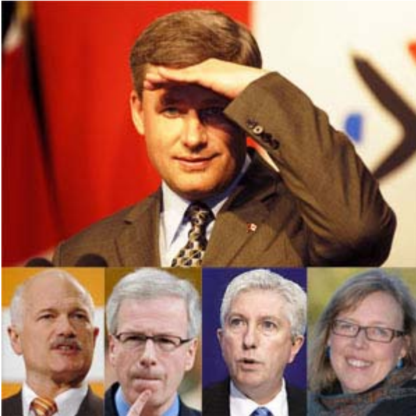
Stephen Harper , Jack Layton , Stéphane Dion , Gilles Duceppe et Elizabeth May

Le Premier ministre sortant du Canada, Stephen Harper (49 ans) est confiant de remporter la prochaine élection du 14 octobre. La question est de savoir s'il sera majoritaire car tous les sondages lui accordent déjà la victoire. L'attention est aussi fixée sur le chef du Parti libéral, Stéphane Dion (53 ans), dont on dit qu'une défaite provoquera un congrès à la chefferie de son parti. La surprise possible serait une victoire minoritaire du parti de Jack Layton (58 ans). (Voir Blogs BPod LeStudio1.com)