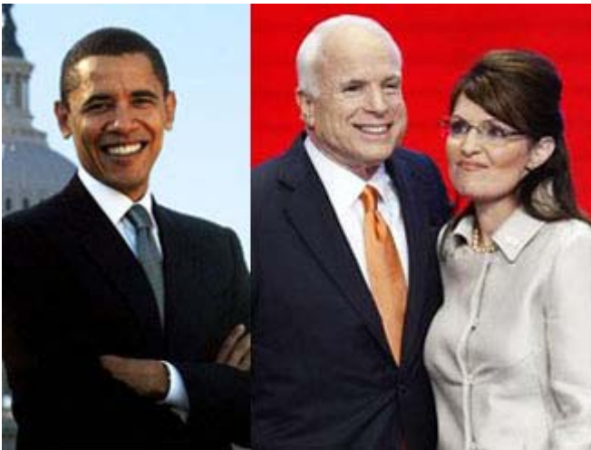
Barack Obama, John McCain et Sarah Palin