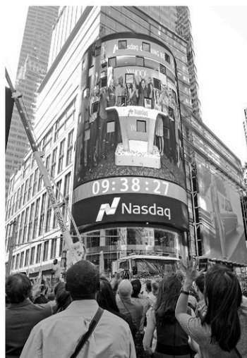
La valorisation boursière de Yahoo! reflète à peu près seulement la valeur de ses participations dans Alibaba et Yahoo! Japan.