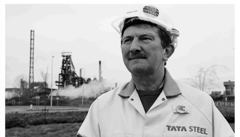
Un employé de Tata Steel devant l'usine de Port Talbot, au Pays de Galles, qui emploie 4000 personnes.