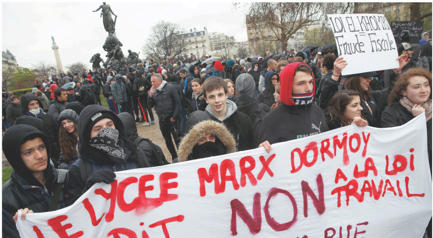
Les étudiants ont été nombreux à participer aux manifestations contre le projet de réforme du droit du travail.