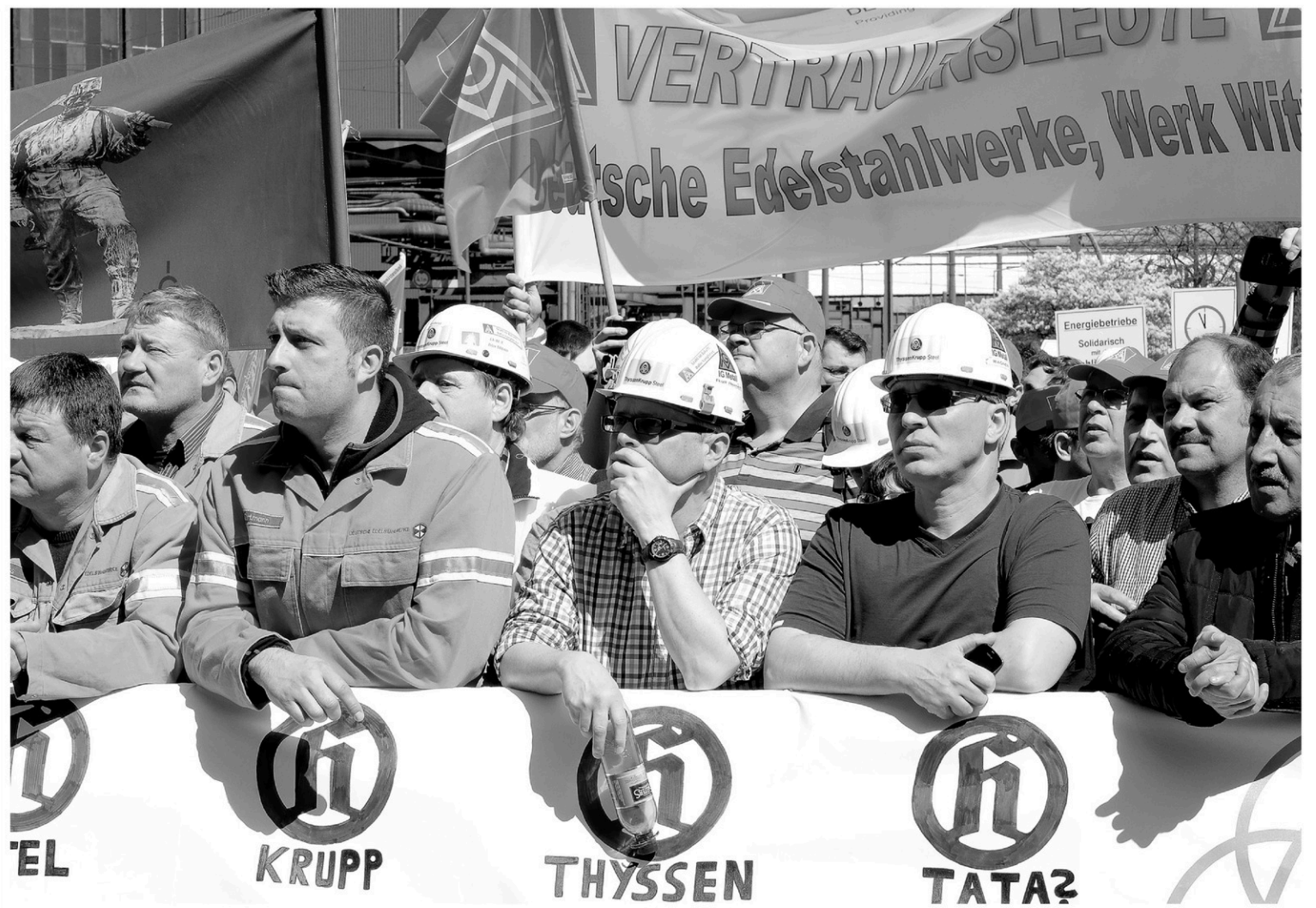
PATRICK STOLLARZ AGENCE FRANCE-PRESSE Tandis qu'à Londres le géant Tata Steel amorçait sa sortie de la sidérurgie au Royaume-Uni, environ 45 000 travailleurs de l'acier manifestaient à Duisbourg, en Allemagne, leur inquiétude quant à la survie de leur industrie. Parce que c'est toute la sidérurgie européenne qui est en crise.