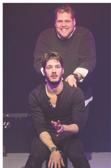
Une scène d' Ils étaient quatre , de Mani Soleymanlou

culturelle, la sympathique bête de théâtre amorce ici une nouvelle trilogie autour du genre, dans une pièce qu'il annonce comme un «pseudoportrait de l'homme d'aujourd'hui».