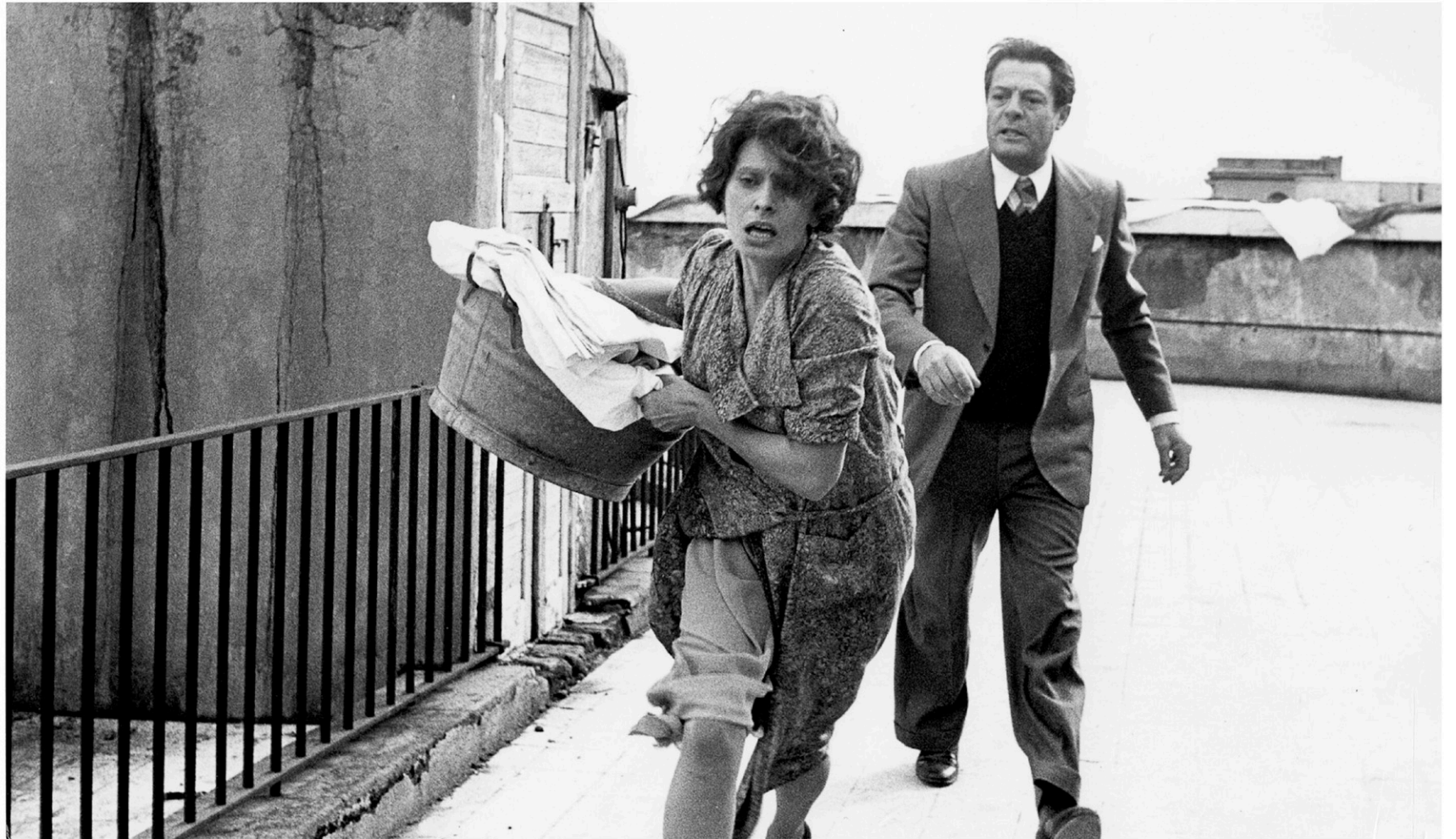
Sophia Loren et Marcello Mastroianni dans le film Une journée particulière , d'Ettore Scola.