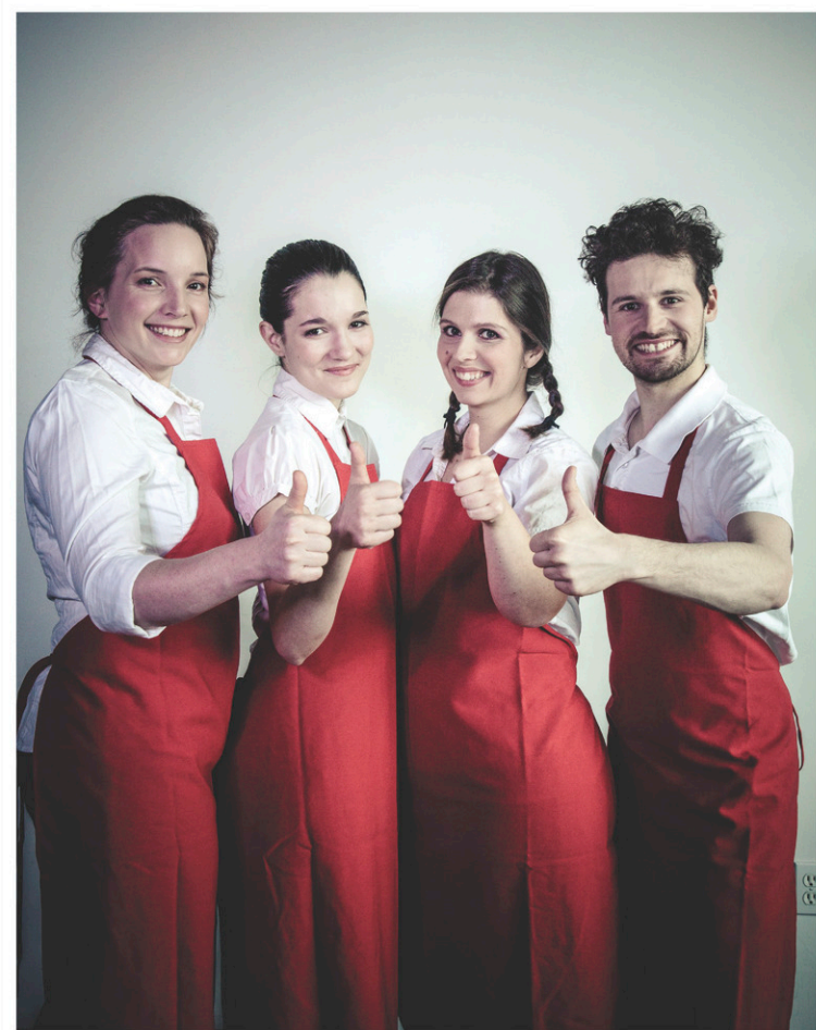
Starshit pousse sa dénonciation dans une satire amusante à la forme dynamique.