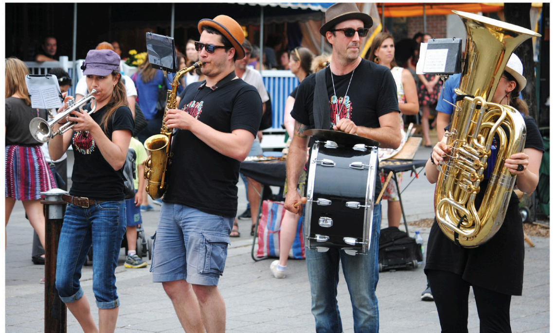
La Fanfare Jarry a été créée en 2012.