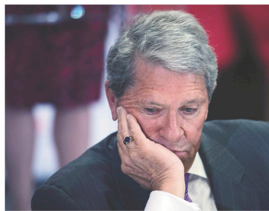
Hunter Harrison, chef de la direction du CP

La décision du CP survient après que le département américain de la Justice eut émis des commentaires négatifs vis-à-vis de la proposition de l'entreprise consistant à mettre sur pied