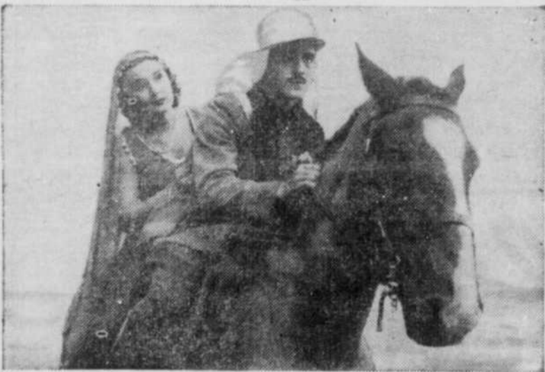
IF PARMIS LES TOUAREGS!

CKAC Dimanche soir à 7.45 h. UN QUART D'HEURE Jeudi soir à 8.00 h. UNE DEMI-HEURE