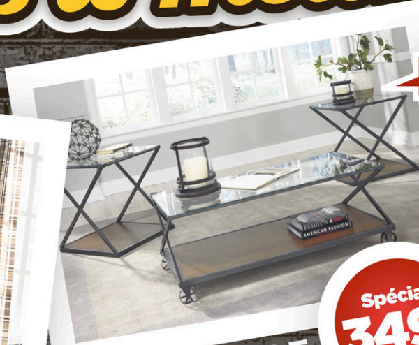
ENSEMBLE DE 3 TABLES DE SALON