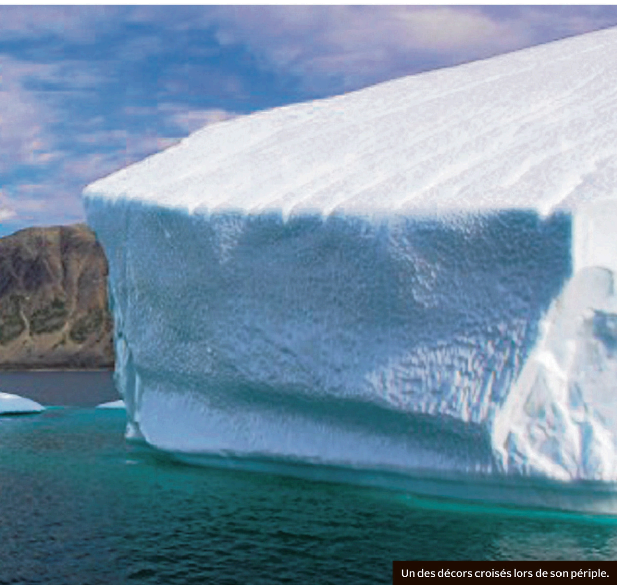
Un des décors croisés lors de son périple.

«Mais veut veut pas, ce voyage va peut-être influencer ma pratique au grand complet», laisse planer celle qui est aussi chargée de cours à l'université Concordia.