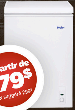
CONGÉLATEUR Coffre 3,5 pi 3