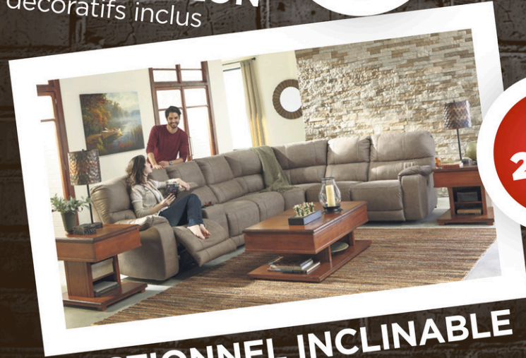
SECTIONNEL INCLINABLE Porte-verre lumineux Lumière de lecture Compartiment de rangement