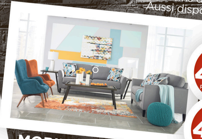
MOBILIER DE SALON Coussins décoratifs inclus