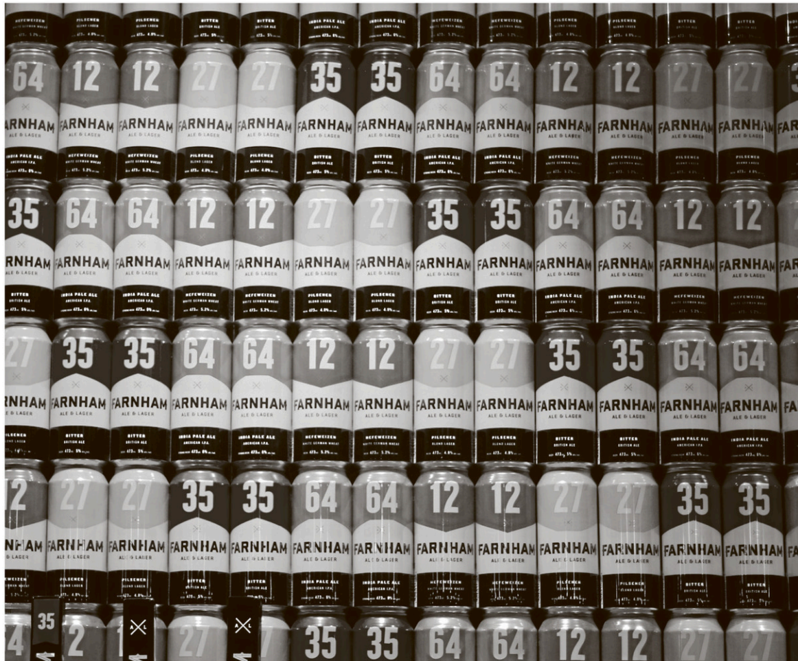
Les produits de Farnham Ale & Lager se retrouvent dans 1400 points de vente au Québec. L'entreprise est aussi présente sur le marché américain depuis l'an dernier.