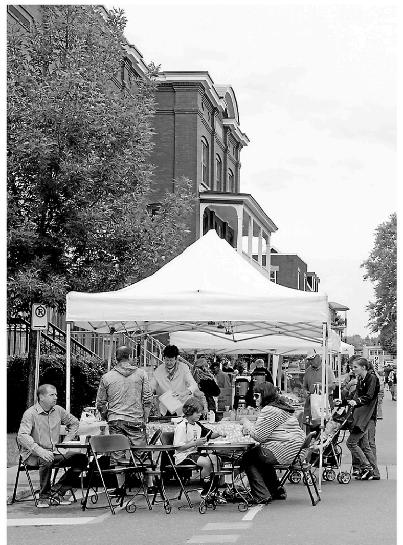
Le plan stratégique 2017-2027 de Farnham fera notamment la promotion des nombreux atouts de la Ville.