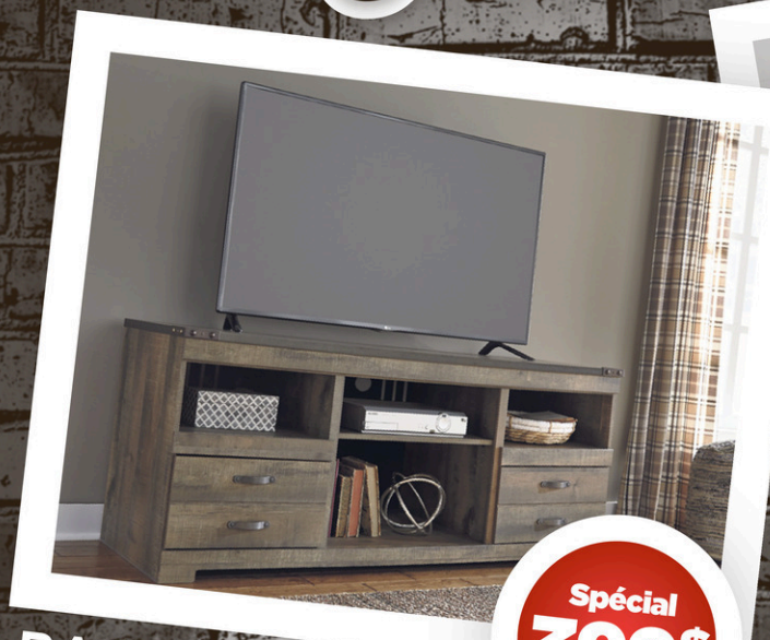
BASE DE TÉLÉ Avec insertions de métal