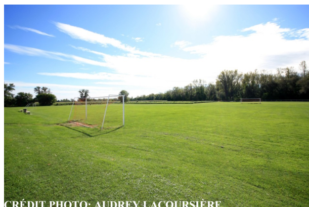
Terrains de soccer

Piscine municipale (Natation et bain libre) 151, rue Gamelin