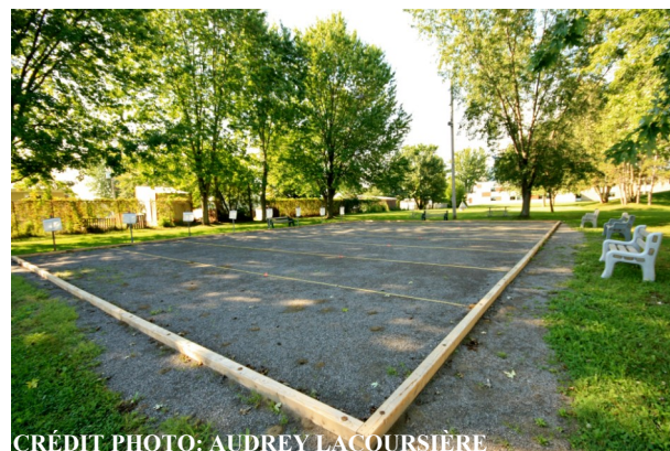
Terrains de pétanque