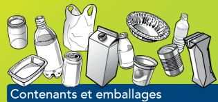
Contenants et emballages