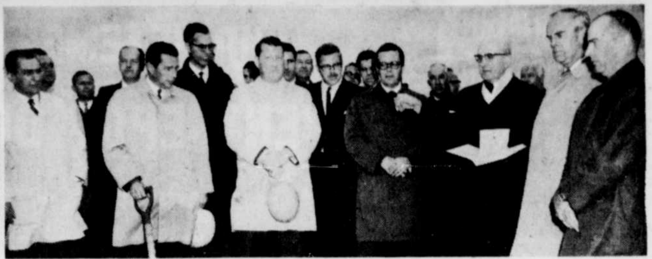
DE NOMBREUSES PERSONNALITES ont assisté à la bénédiction du terrain où sera construite une nouvelle usine à Richmond. Les travaux doivent débuter d'ici dix ou quinze jours. Cette usine sera une filiale des usines