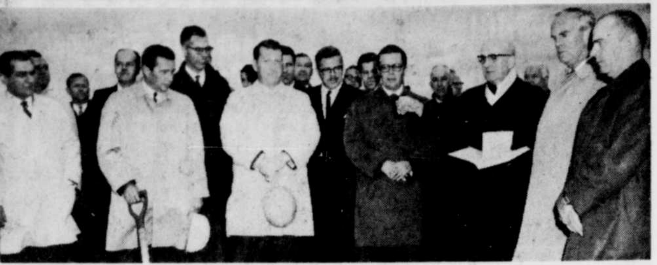
DE NOMBREUSES PERSONNALITES ont assisté à la bénédiction du terrain où sera construite une nouvelle industrie à Richmond. Les travaux doivent débuter d'ici dix ou quinze jours. Cette usine sera une filiale des usines