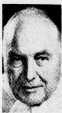
Le juge Ronald MARTLAND