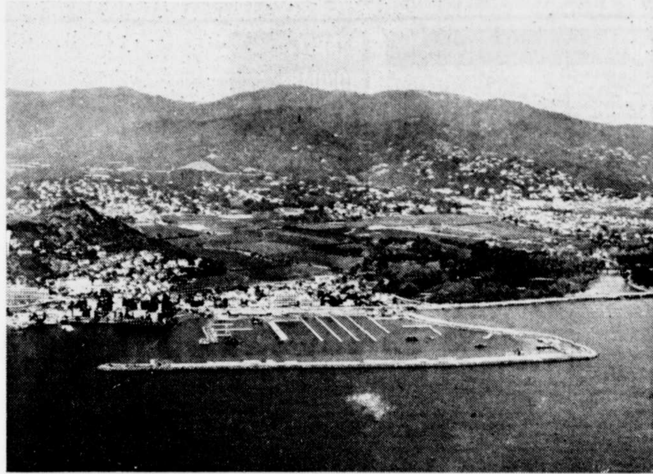
C'est dans le site enchanteur de Cannes, sur le bord de la Méditerranée, que se négocient, à l'échelle mondiale, les échanges de programmes de télévision.

Travailler dans une telle féerie de couleurs avec l'odeur des fleurs, des citronniers et des oranges peut provoquer deux réactions: donner le goût de flâner ça et là parmi la foule cosmopolite, élégante et surtout cossue qui fréquente la Côte d'Azur ou bien uti-