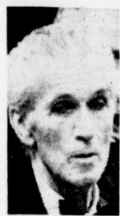
Le juge en chef, Bora LASKIN