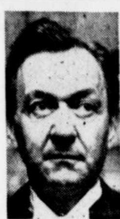
Le juge Willard ESTEY