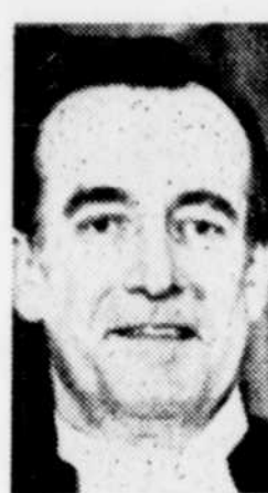
Le juge Brian DICKSON