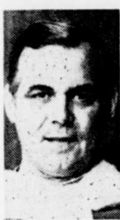
Le juge Julien CHOUINARD