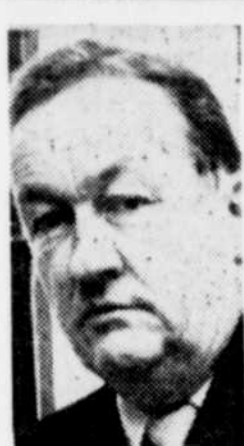
Le juge William McINTYRE