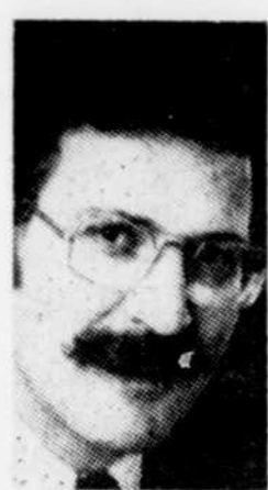
Le juge Antonio LAMER