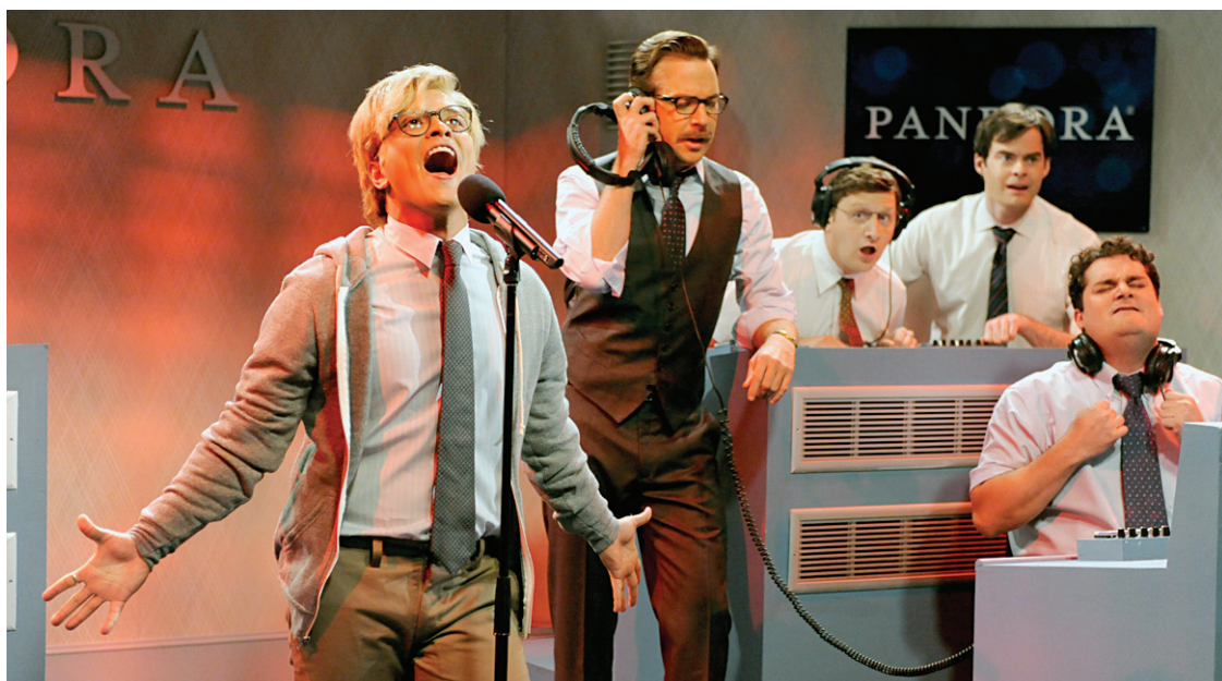
Saturday Night Live est un classique show de variétés avec sketches, prestation musicale, bulletin de nouvelles bidon et monologue d'un animateur différent chaque semaine.

C'est l'idée du direct qui t'a séduite? Ben voyons donc! Le direct, même si on n'en fait plus guère, est l'essence même de la télévision. Et puis c'est en vente libre, à ce que je sache. Je sais que par frilosité (les producteurs préfèrent l'euphémisme recherche d'excellence), on n'en