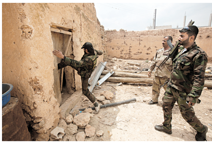
JOSEPH EID AGENCE FRANCE-PRESSE

Avant la publication de l'entretien, la Coalition nationale de l'opposition syrienne a dénoncé «un acte horrible et inhumain» et affirmé «condamner cet acte, s'il est avéré».