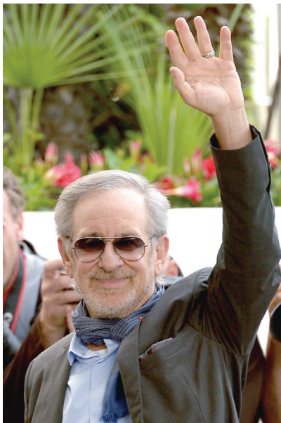
Le réalisateur Steven Spielberg, président du jury du 66 e Festival de Cannes, arrivant à l'Hôtel Martinez, mardi.