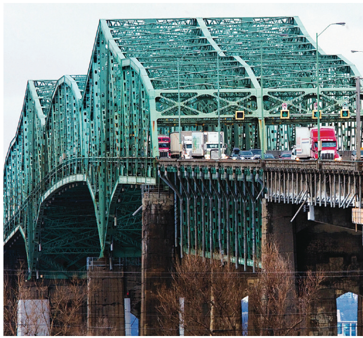
Même s'il ne cesse de se dégrader, le pont Champlain ne présente pas de risque pour les automobilistes, assurent les autorités.

Outre le concours d'architecture, le comité épaulé par des experts locaux et internationaux en architecture et en design examinera deux autres options, soit le « dialogue compétitif — une procédure qui permet de discuter de diverses solutions avec des candidats potentiels — et l'élaboration de lignes directrices architecturales », a expliqué le ministre