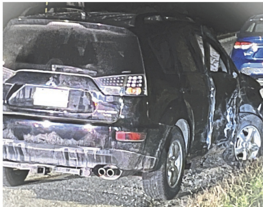
Le véhicule a été percuté par la moto au moment d'un virage à gauche pour emprunter le 5 e rang de Saint-Norbert-d'Arthabaska.