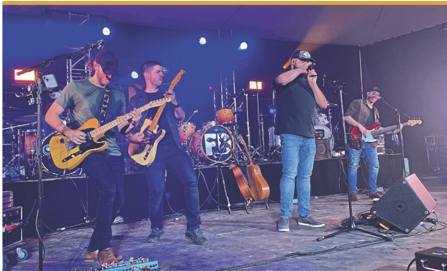
Le Festival de l'érable se tient du 30 avril au 4 mai.