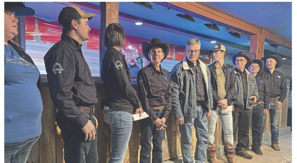
Le comité organisateur et les bénévoles ne ménagent pas les efforts pour assurer la réussite de l'événement.