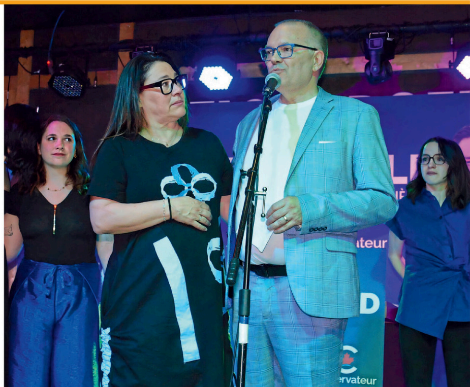
Luc Berthold a décroché un quatrième mandat.

Il a de plus remercié son chef Pierre Poilievre de sa confiance. Ce dernier l'avait nommé leader parlementaire adjoint lors de la dernière législature. « Je parlais tous les