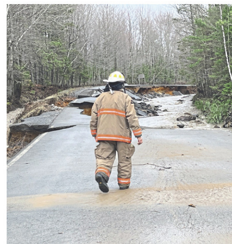
Les ravages de l'eau

Les policiers avaient alors localisé la personne dans le dépanneur pour ensuite la menotter. La personne, selon le BEI, aurait alors subi une perte de conscience et les premiers soins lui auraient été prodigués jusqu'à l'arrivée des paramédics. La personne a ensuite été transportée à l'hôpital où son décès a été constaté. En possession du rapport d'enquête du BEI, le DPCP déterminera après analyse des faits et du droit applicable s'il y a lieu de porter des accusations contre les policiers impliqués. Le rapport du BEI contient l'ensemble des composantes de l'enquête. On y retrouve