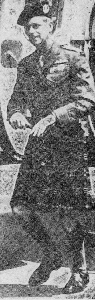
Portant l'uniforme des Cameron Highlanders, le duc d'Edimbourg arrive à Lunebourg, en Allemagne, pour passer en revue le régiment qui s'y trouve stationné. A titre de colonel du régiment, le duc a reçu l'épée officielle du Highland d'Écosse. Il a piloté son propre avion de Paris à Lunebourg.

C'est facile, c'est profitable de placer une annonce classée dans les pages du "Droit". — Téléphonez 3-4061.