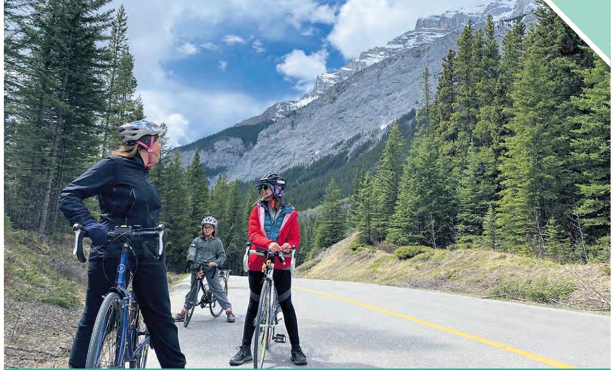
Avec quelques années de délais, la famille pourra enfin réaliser son rêve de sillonner les routes d'Europe à vélo. On les voit ici dans l'Ouest canadien, alors qu'ils avaient dû s'en remettre à un plan B en 2020.

Il est possible de suivre la famille dans sa grande aventure grâce à la page Facebook 4 vers le monde.