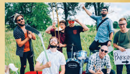
TASSEZ-VOUS DE D' LÀ 20 H 30