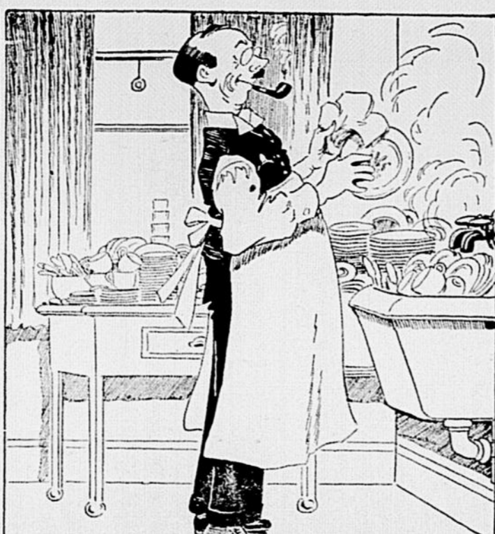
ELLE N'EST PAS PLUTÔT SORTIE QUE TU ENDOSSES UN TABLIER ET ATTAQUE LA VAISSELLE AVEC UNE BELLE ARDEUR, COMPTANT BIEN TE DÉBARRASSER DE TOUT ÇA EN UN TOUR DE MAIN.