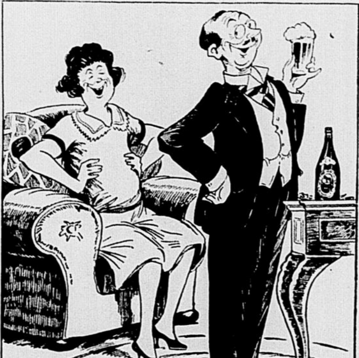
T'AS PAS APRÈS CELA ESSAYÉ UNE BLACK HORSE ? C'EST ENCORE LE MEILLEUR MOYEN DE RIRE LE DERNIER.

dites simplement — "Bière Black Horse Dawes s.v.p.!"