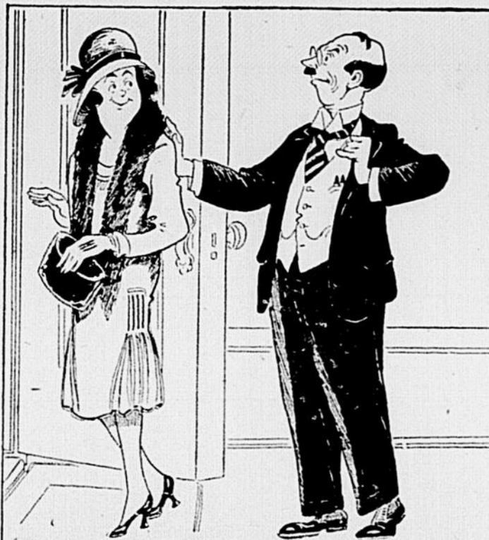
T'AS PAS DÉJÀ OFFERT À TA MOITIE DE LAVER LA VAISSELLE ET DE PRENDRE SOIN DES ENFANTS PENDANT QUELLE IRAIT AU CINEMA, POUR LUI PROUVER QUE LES FEMMES ONT TORT DE PRETENDRE QUE LEUR TÂCHE N'EST JAMAIS FINIE ?