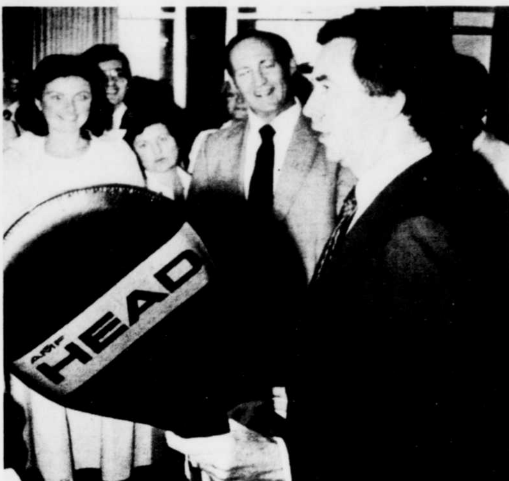
Maintenant que M. Clark en a eu une en cadeau, on ne pourra plus dire qu'il n'en a pas.