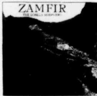
Zamfir The Lonely Shepherd