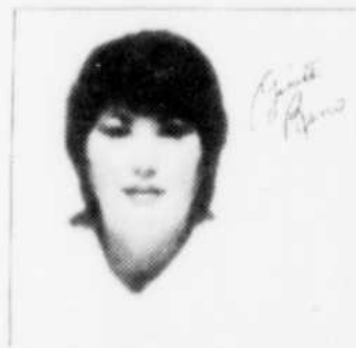
Ginette Reno Quand on se donne