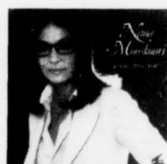
Nana Mouskouri Vivre avec toi