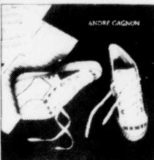
André Gagnon Virage à gauche