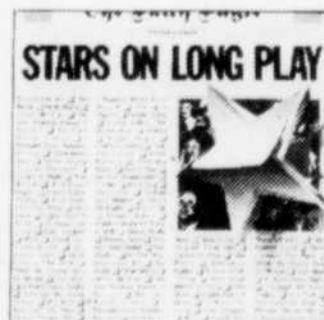
Stars on Long Play Many Top Name Artists