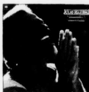
Julio Iglesias Sono Un Pirata